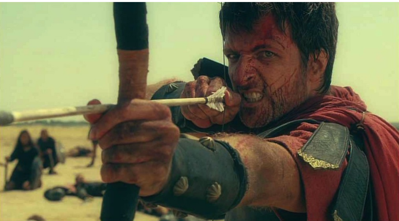
Hispania, la Leyenda : Marco décoche une flèche...