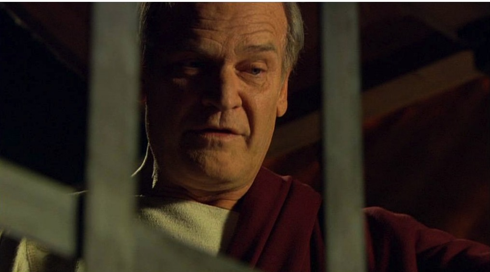
Hispania, la Leyenda : Informé de ce projet, Galba fait jeter...