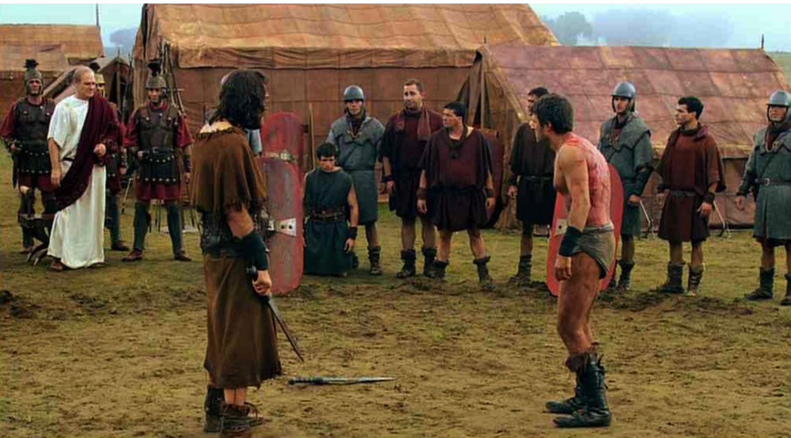
Hispania, la Leyenda : mais les soldats obtiennent qu'il puisse se relever,