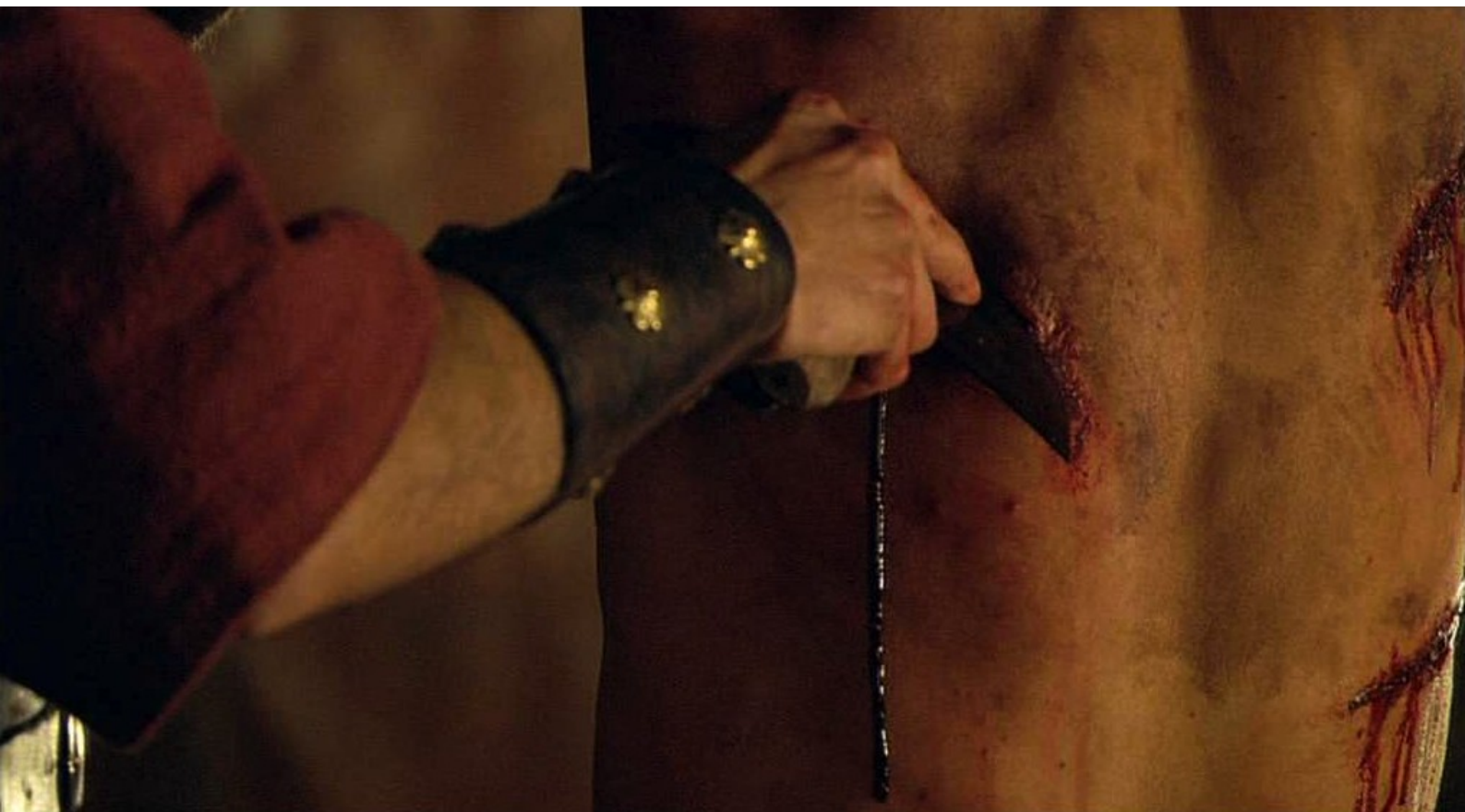
Hispania, la Leyenda : torturer...