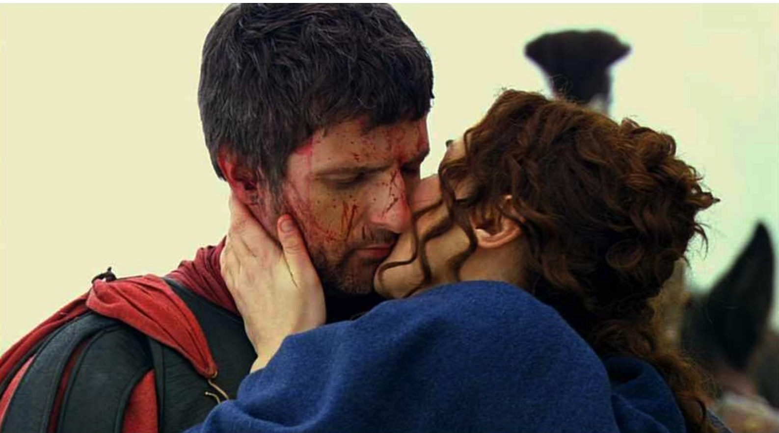
Hispania, la Leyenda : retrouve son amant Marco,