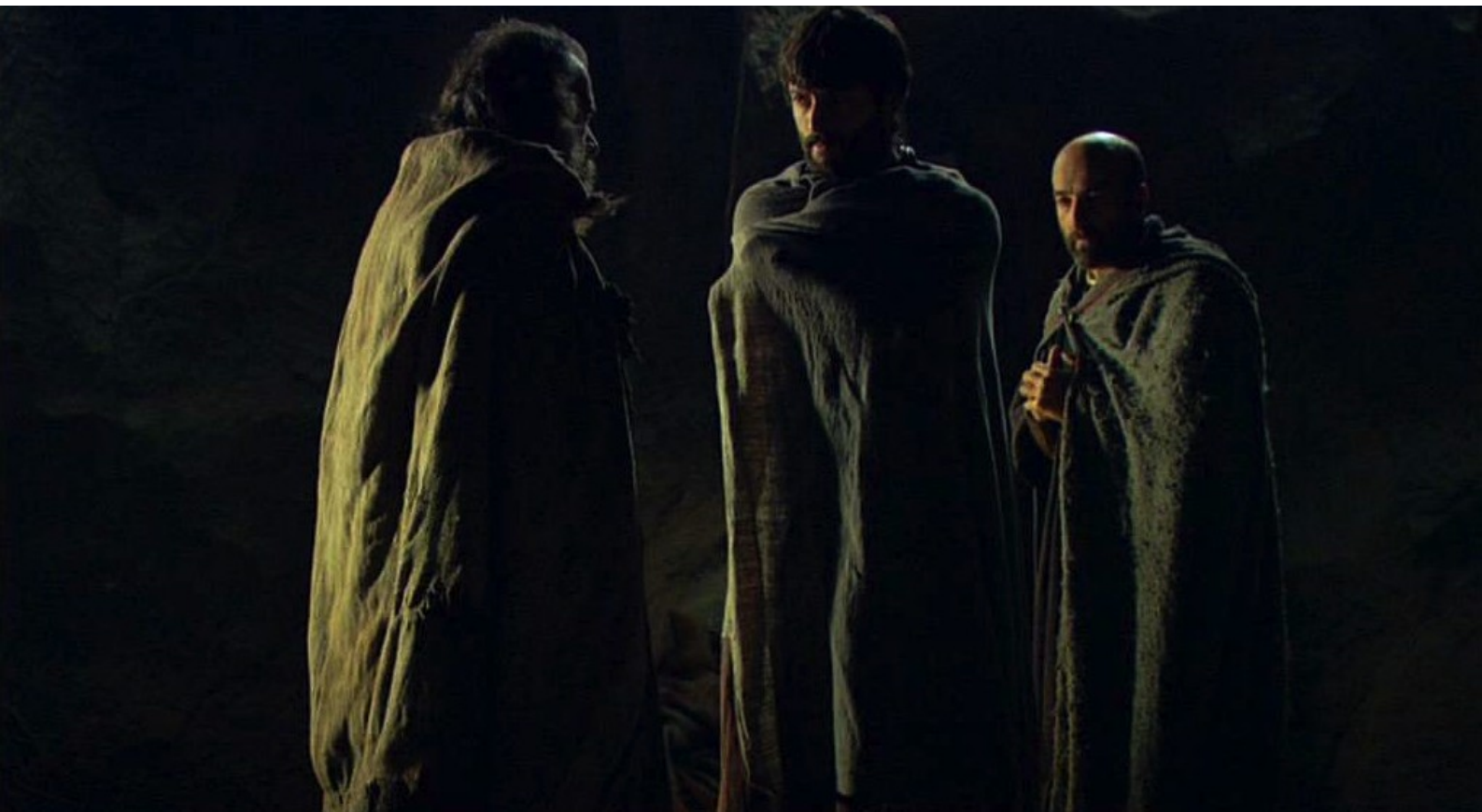
Hispania, la Leyenda : qui doivent se réfugier dans une grotte avec Orestes.