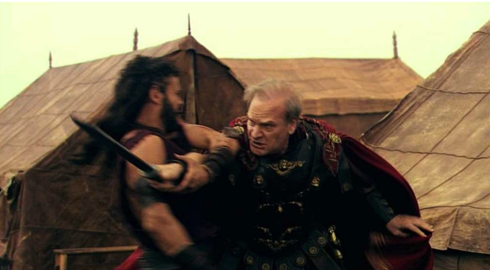
Hispania, la Leyenda : dans un combat acharné ;