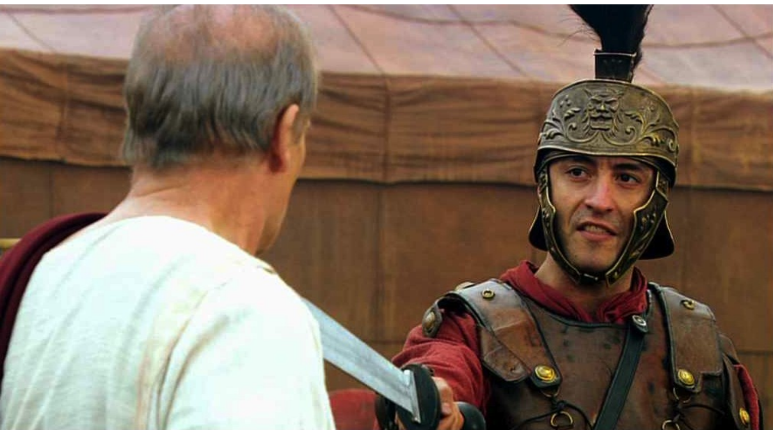
Hispania, la Leyenda : coupable à leurs yeux d'avoir maltraité leur général bienaimé.