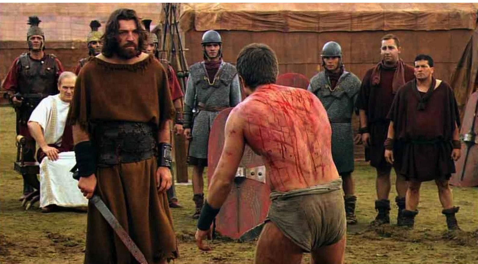
Hispania, la Leyenda : afin qu'il affronte Marco...