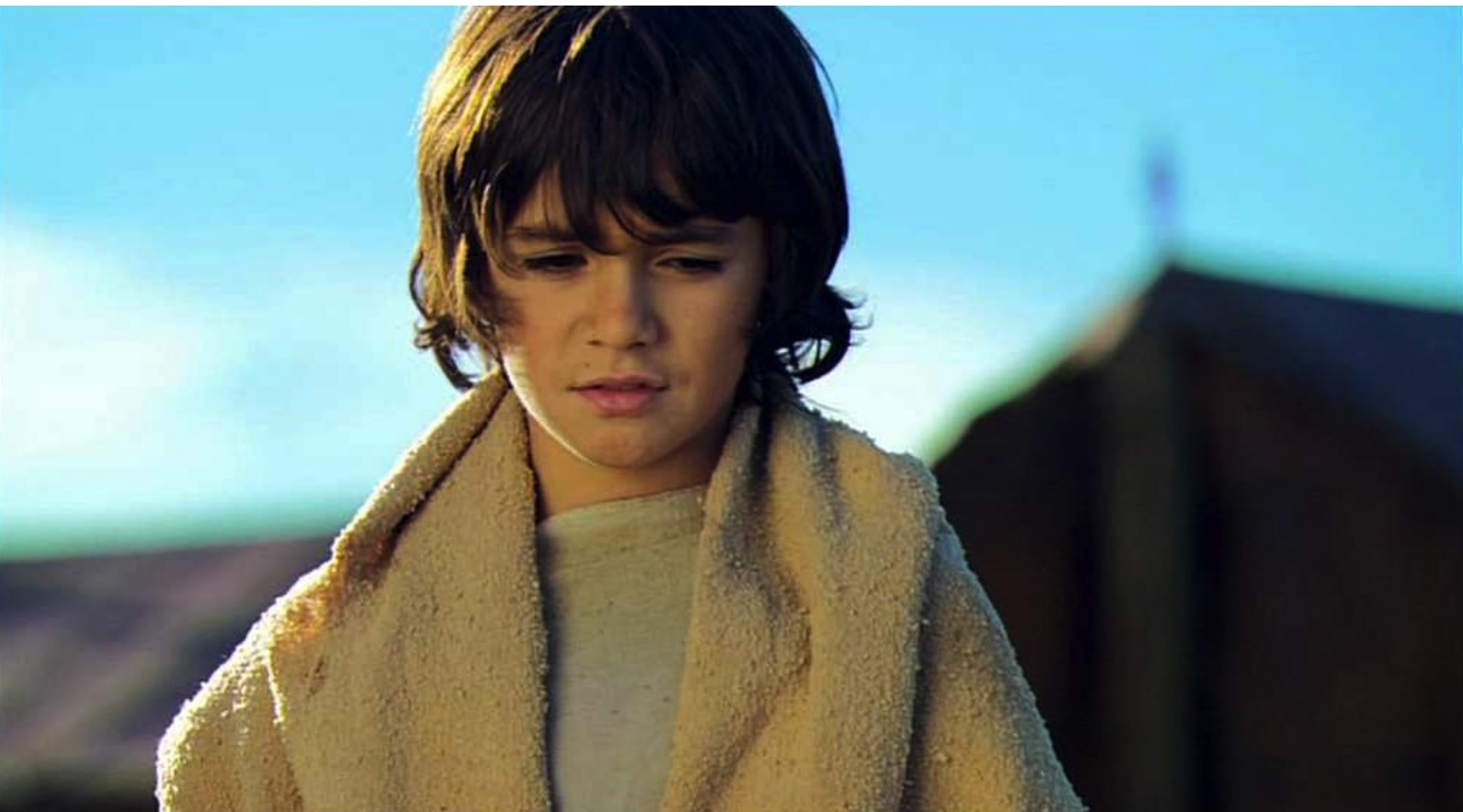
Hispania, la Leyenda : qui regarde les corps...