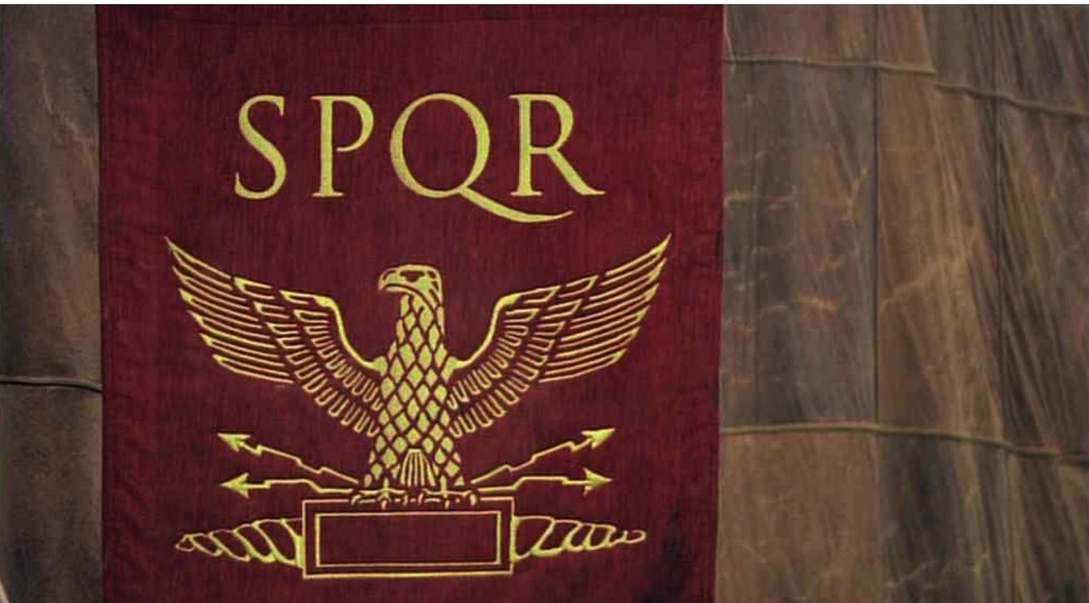
Hispania, la Leyenda : et Viriate aperçoit l'étendard de la légion.