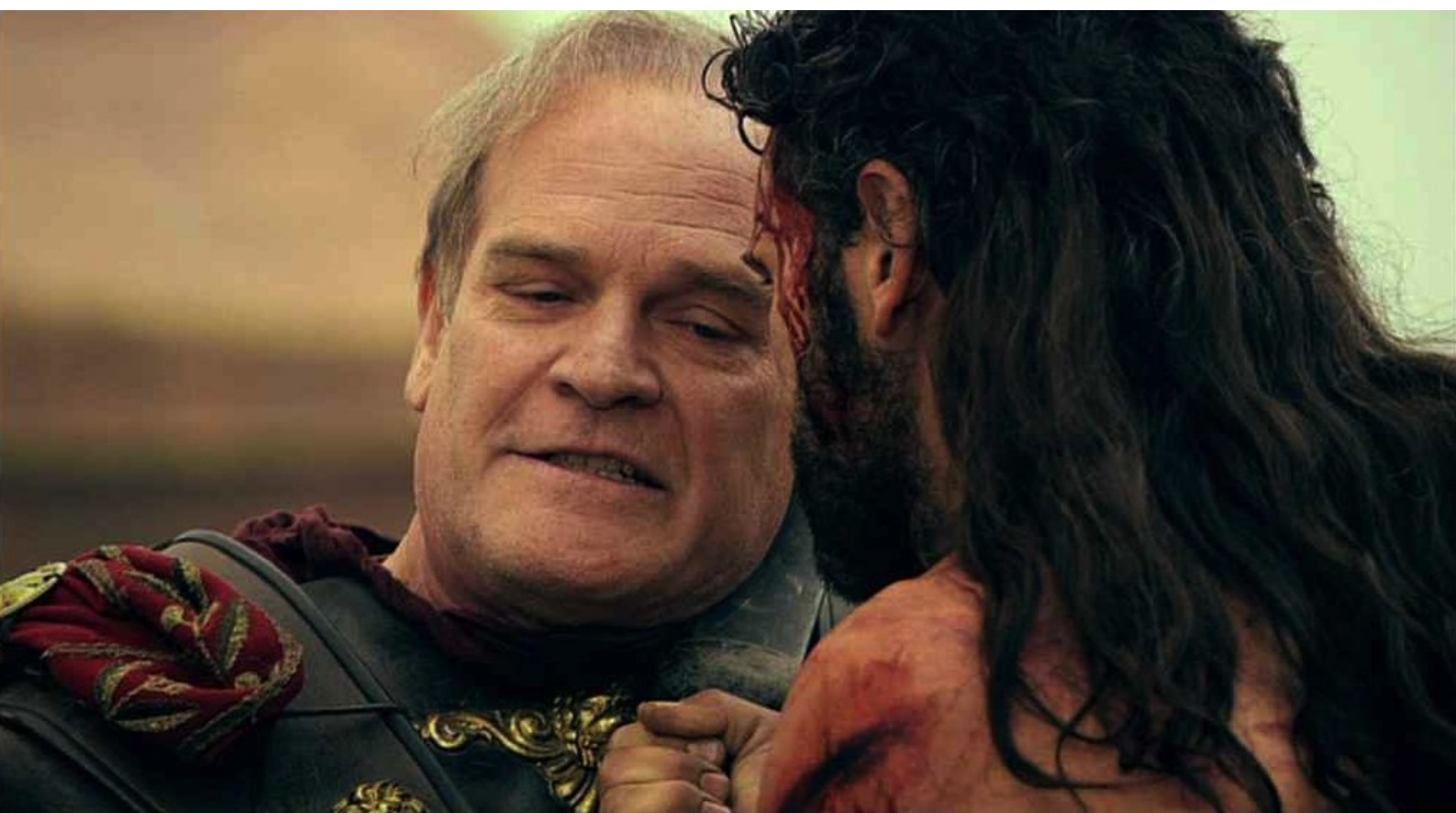
Hispania, la Leyenda : mais, en plein duel, Claudia poignarde son mari dans le dos ;