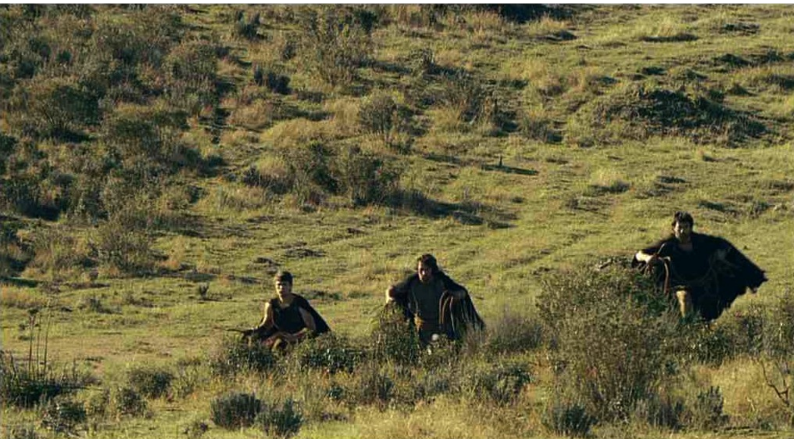
Hispania, la Leyenda : Mais voici que des nationalistes approchent des murailles...