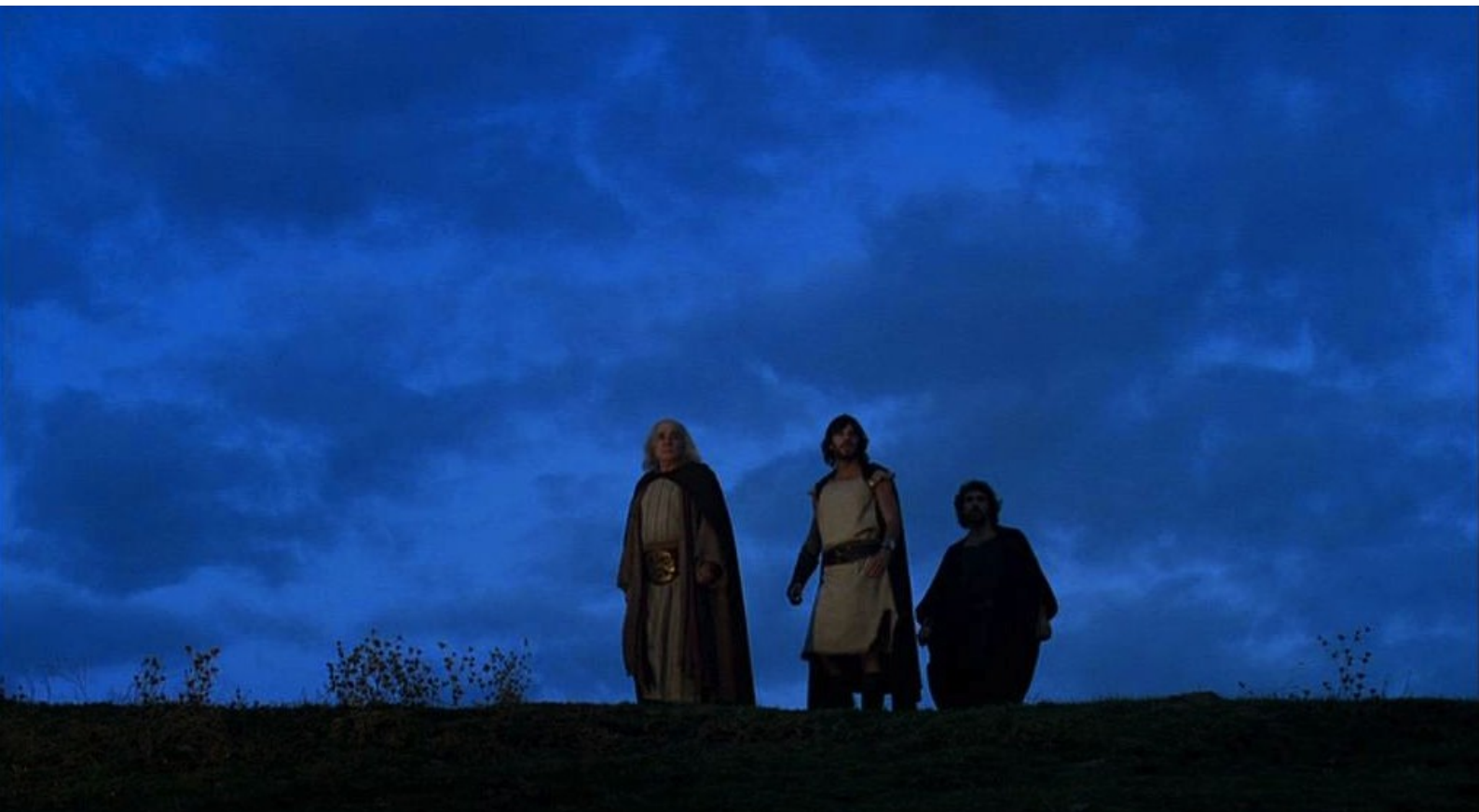
Hispania, la Leyenda : qui les conduisent sur une crête...