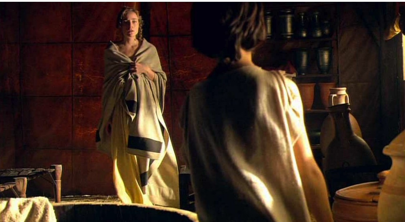
Hispania, la Leyenda : mais Sabina les surprend...