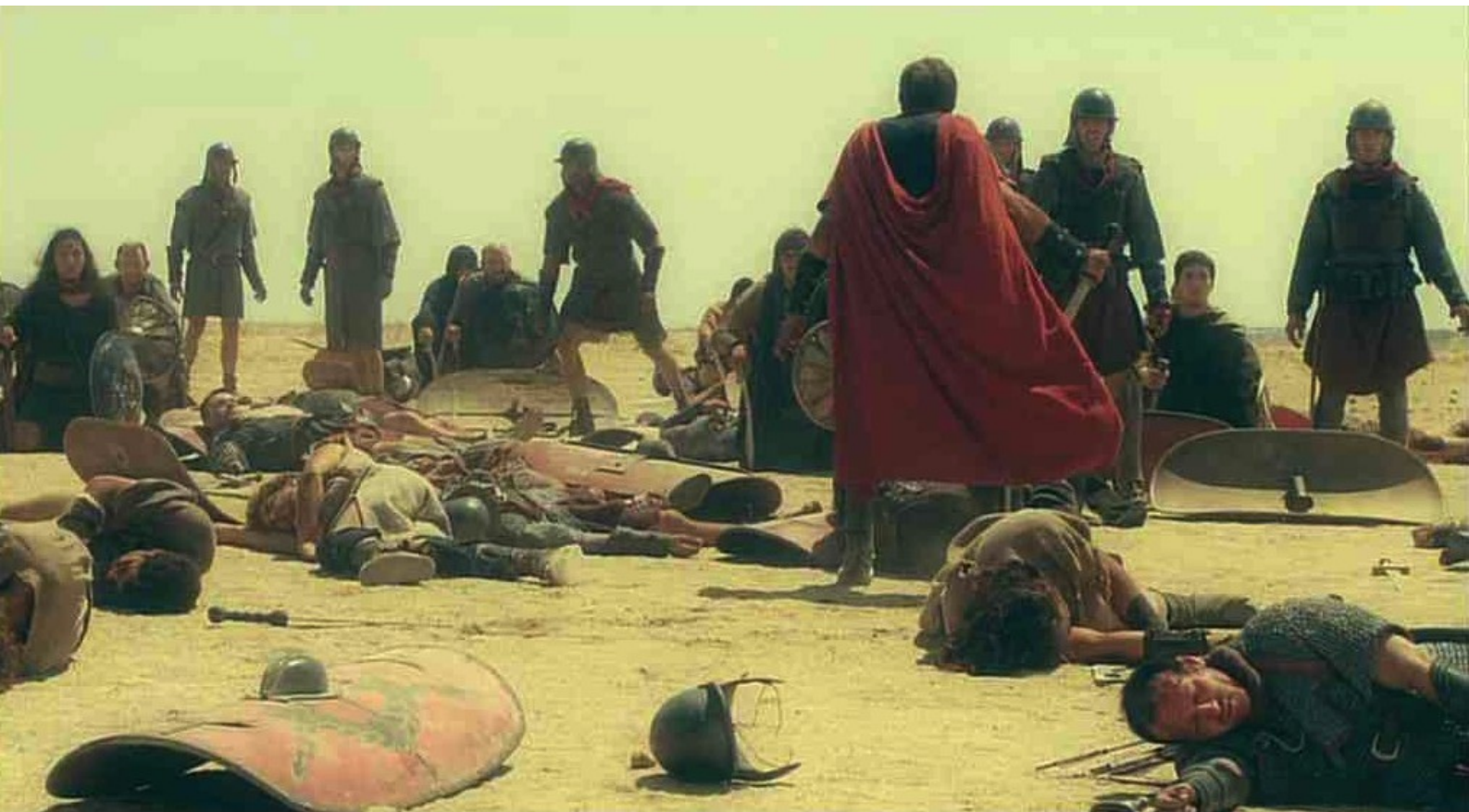
Hispania, la Leyenda : Sentant la défaite proche,