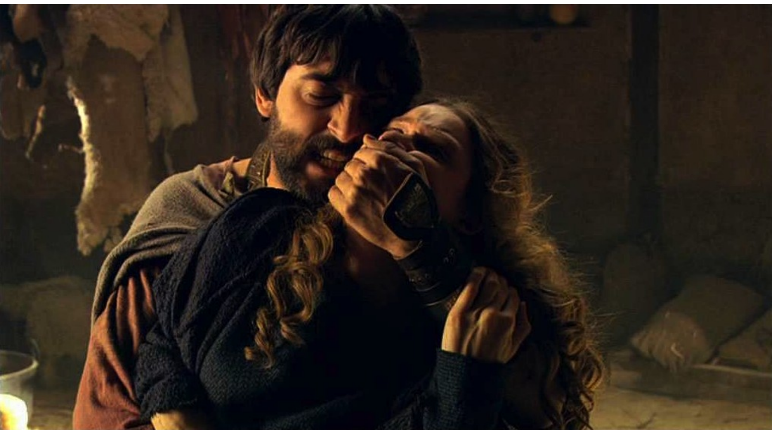
Hispania, la Leyenda : et Alejo enlève Helena en l'absence de Viriate.