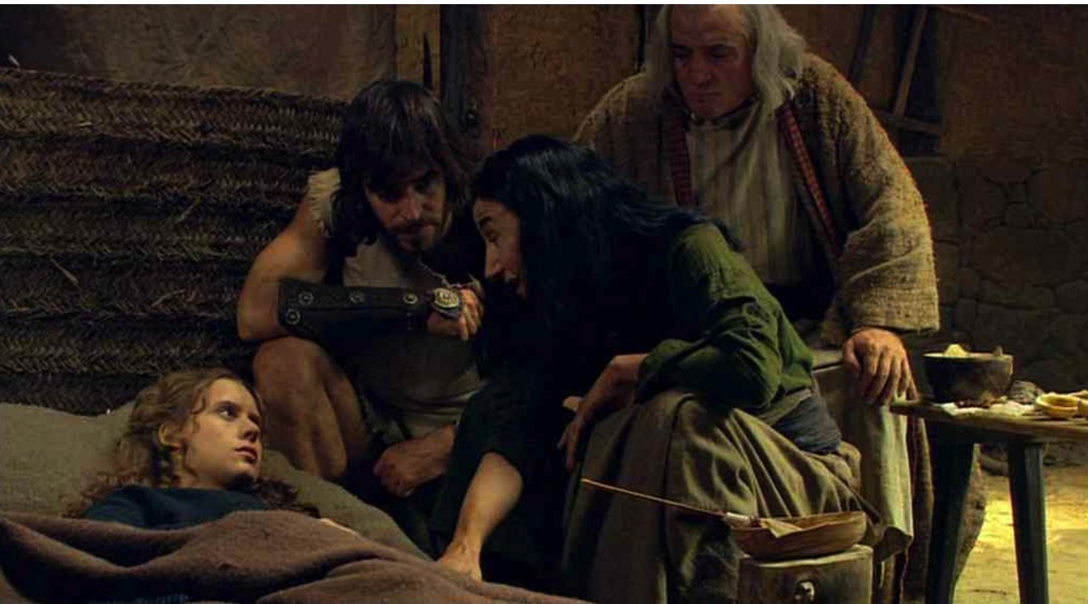
Hispania, la Leyenda : il se révèle qu'elle est enceinte.