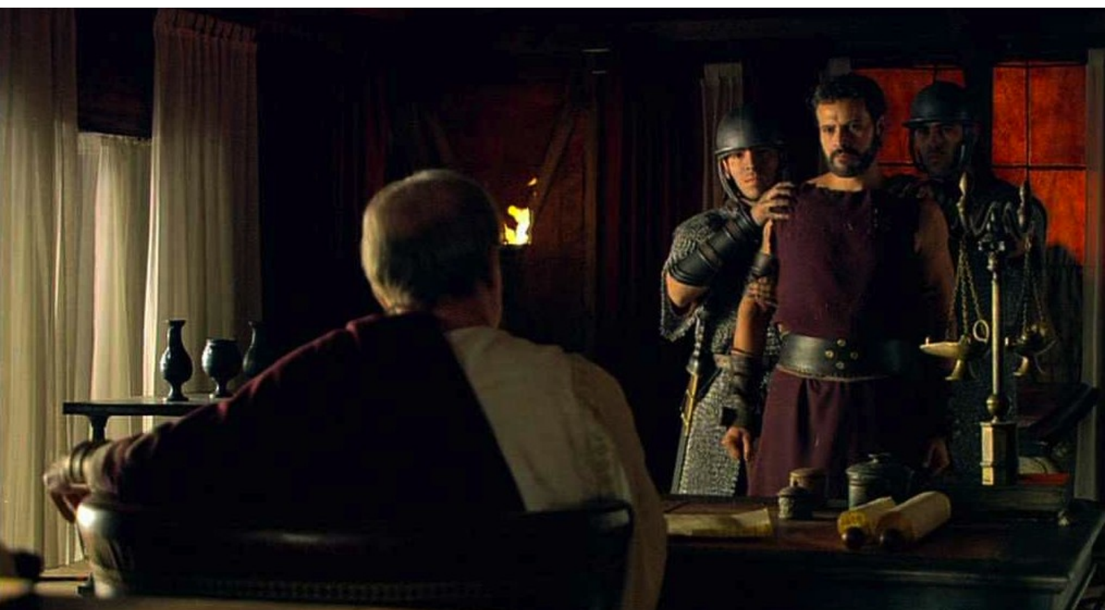
Hispania, la Leyenda : Il accueille également Viriate, qui s'était rendu,