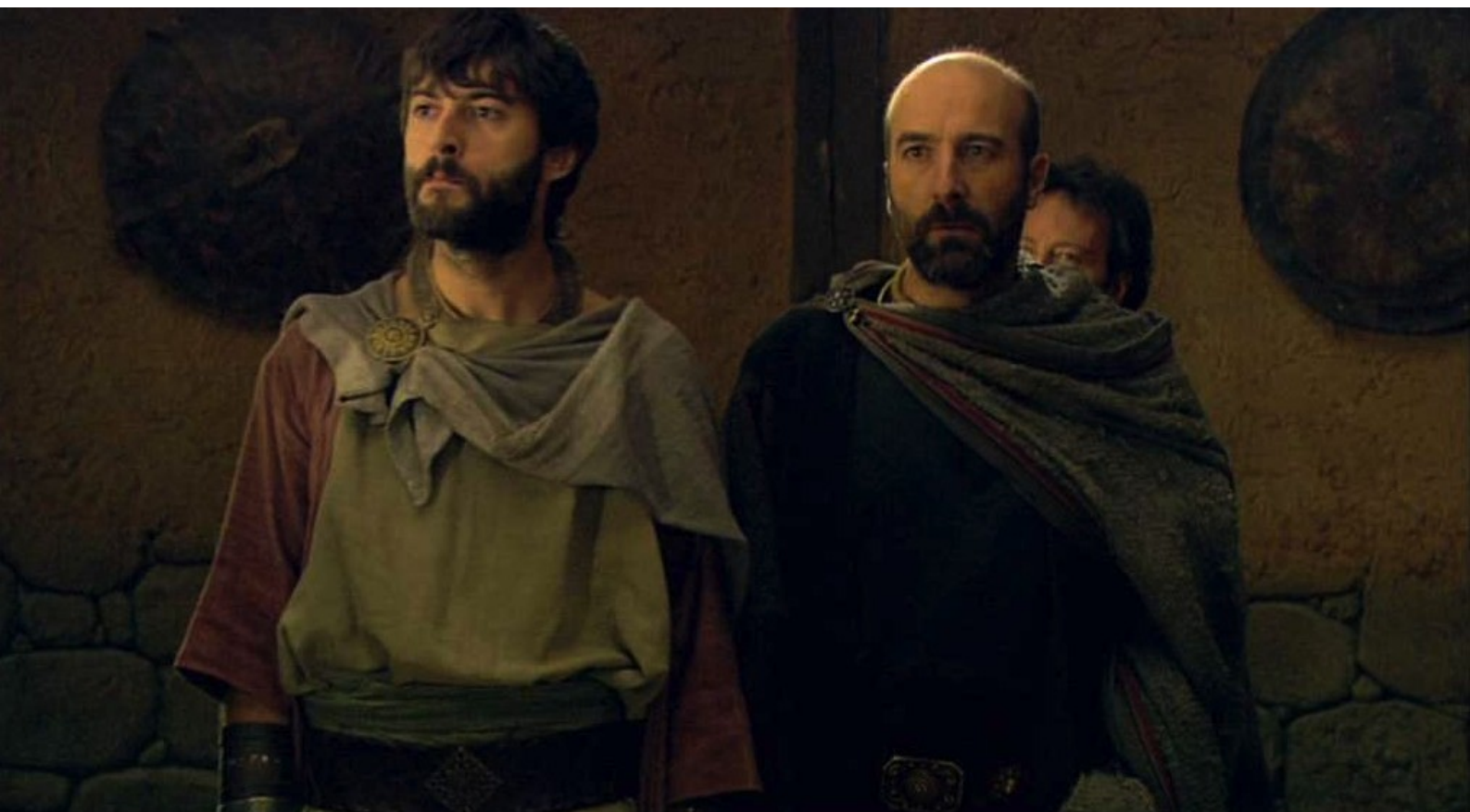
Hispania, la Leyenda : décide d'exiler Alejo et Teodoro,