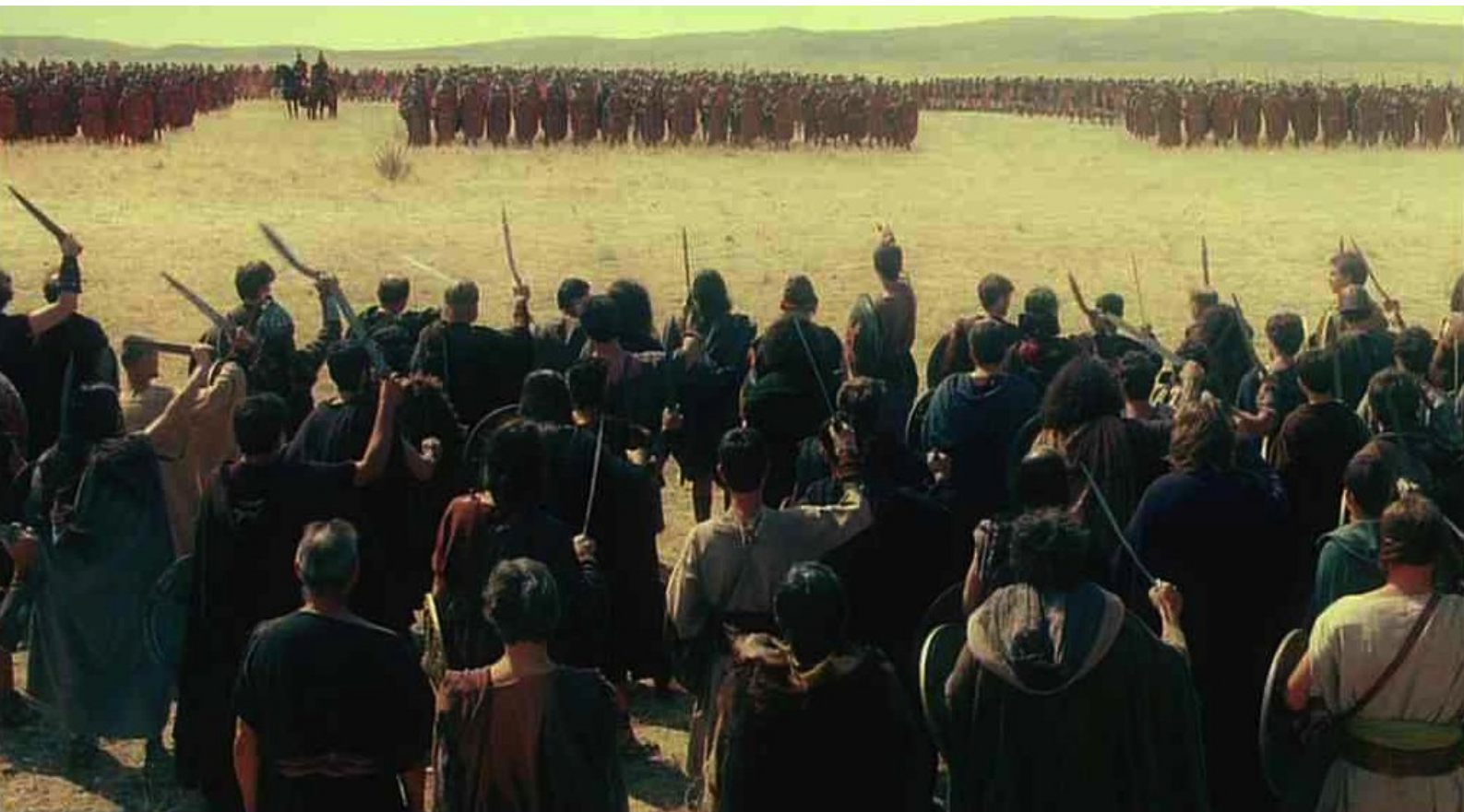
Hispania, la Leyenda : Puis les Lusitaniens poussent leur cri de guerre...