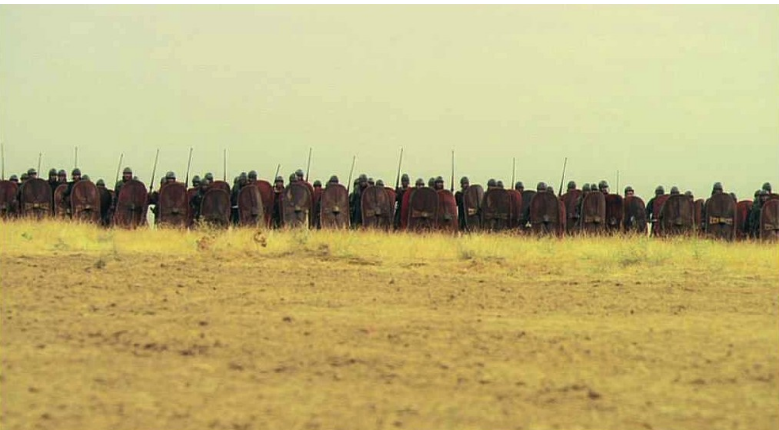
Hispania, la Leyenda : mais l'armée part sans lui,