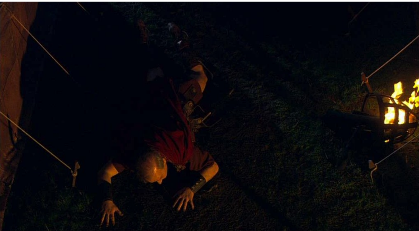
Hispania, la Leyenda : Galba, blessé mais survivant, se traîne dans le camp ;