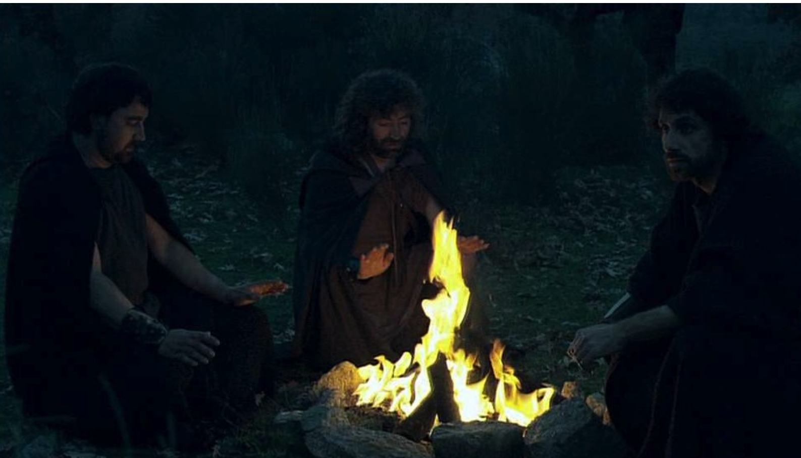
Hispania, la Leyenda : Dans la nuit, Dario et Césaró rencontrent des chefs rebelles...

Comme portfolios du numéro 46 de La 12 e Heure , nous vous offrons plusieurs florilèges de photos tirées des épisodes de la série Hispania, la Leyenda , à laquelle nous avons consacré presque tout le numéro 46 de notre fanzine.