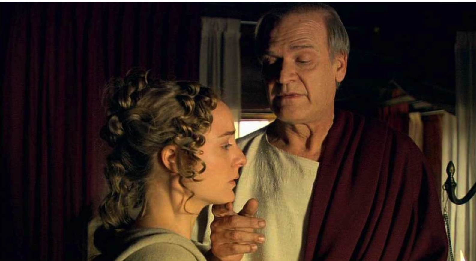
Hispania, la Leyenda : qui décide de se l'approprier.