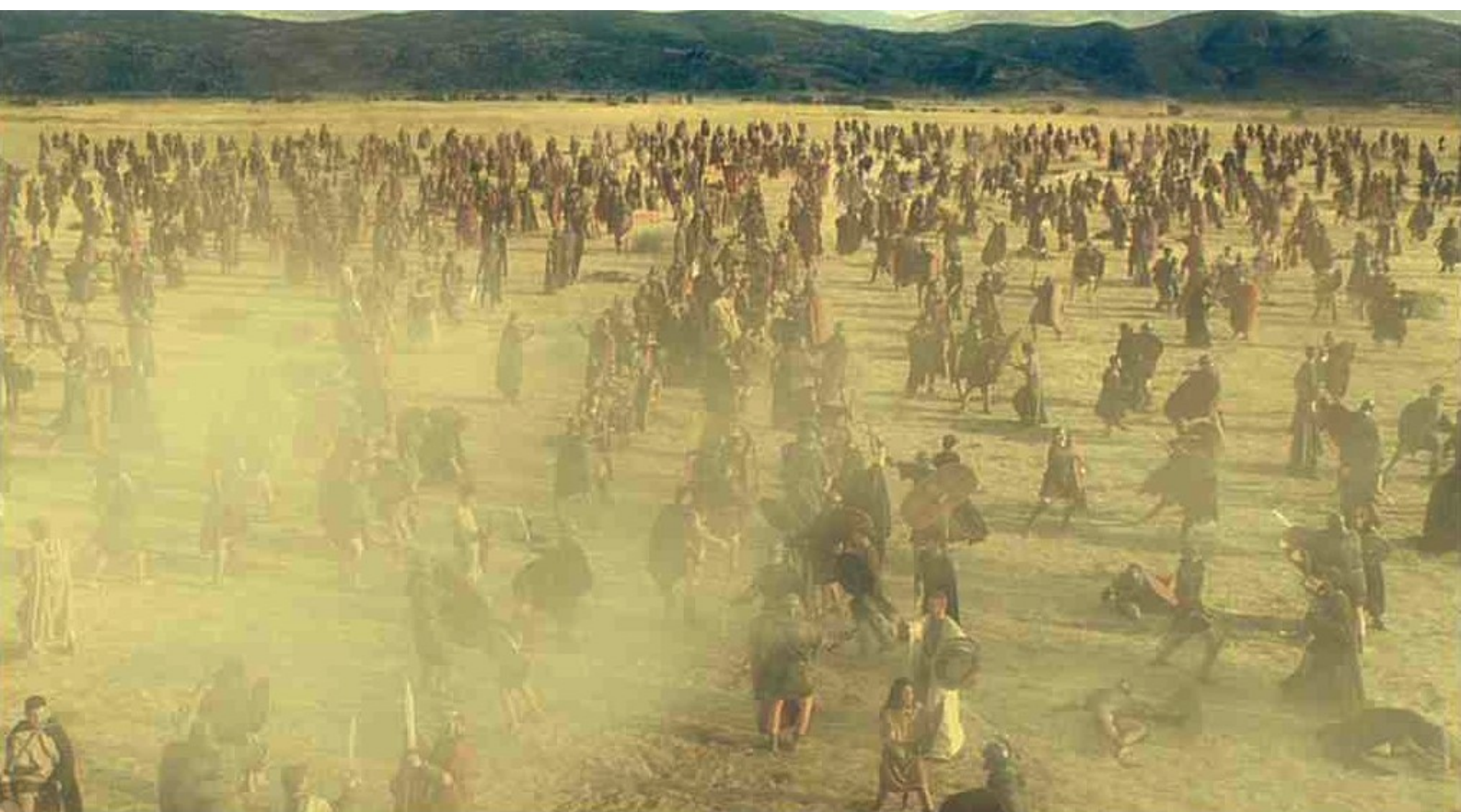
Hispania, la Leyenda : et c'est la mêlée générale.