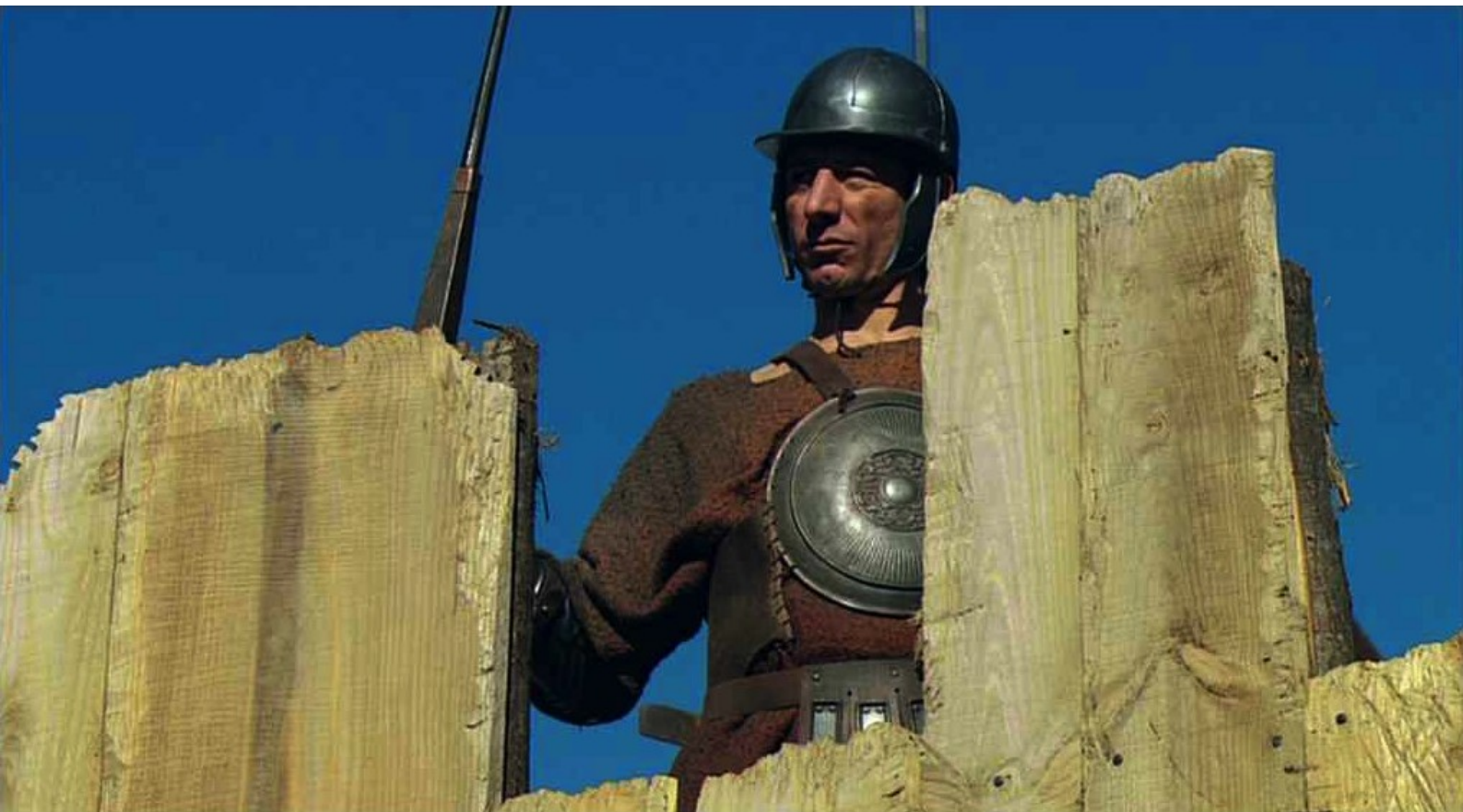
Hispania, la Leyenda : ne laissant que quelques sentinelles au camp.