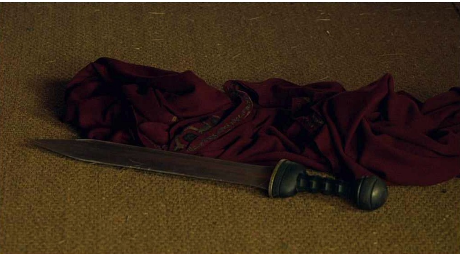
Hispania, la Leyenda : mais il préfère jeter son épée...