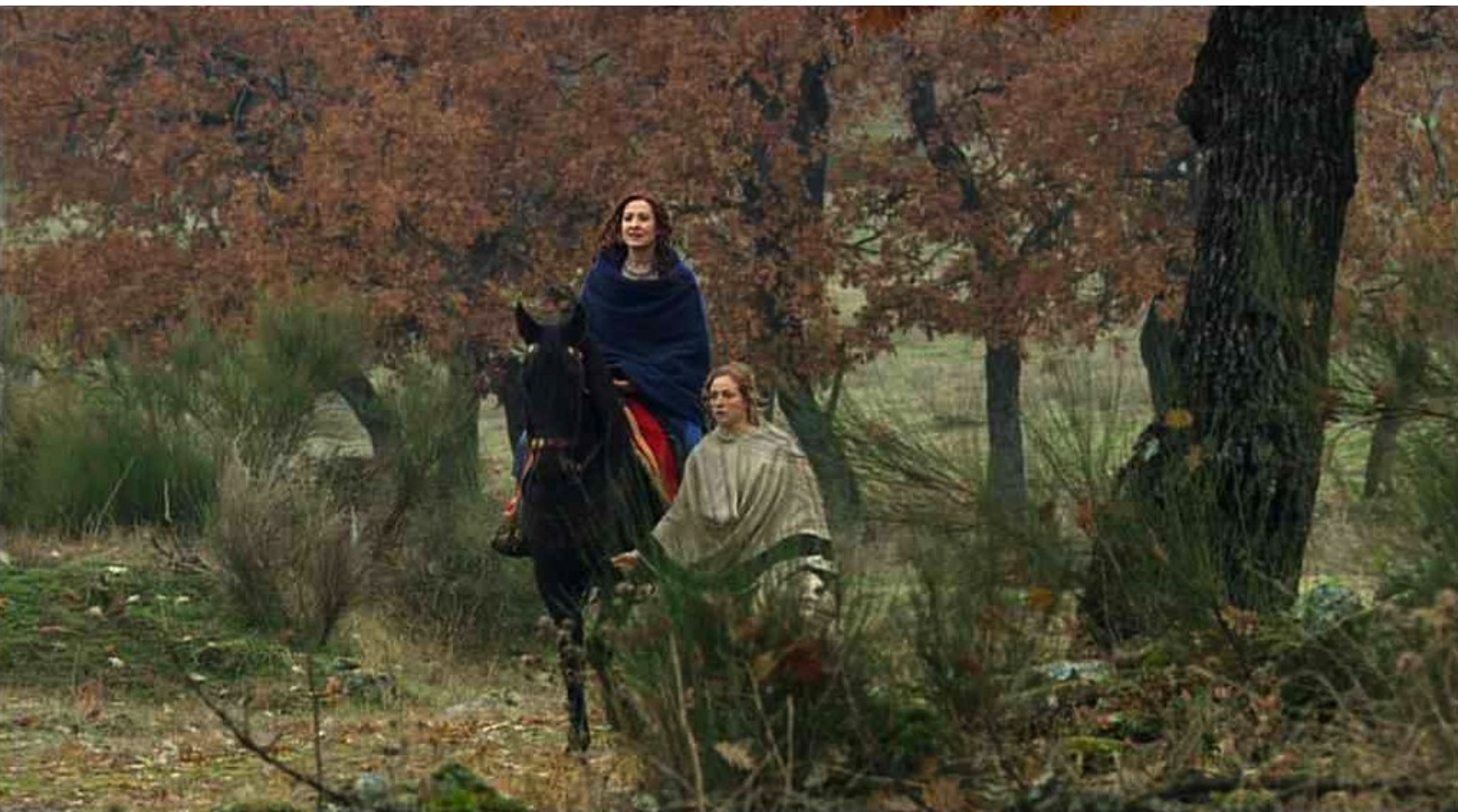
Hispania, la Leyenda : Claudia, qui a fui le camp avec Sabina,