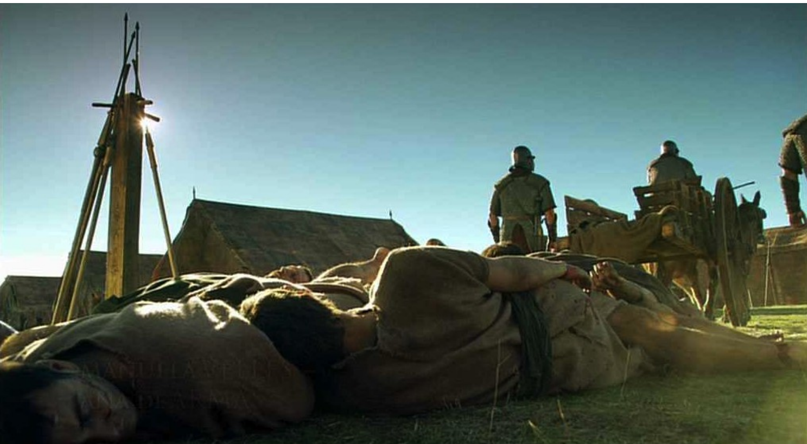
Hispania, la Leyenda : il les fait descendre des croix et transporter près de l'enclos des porcs.