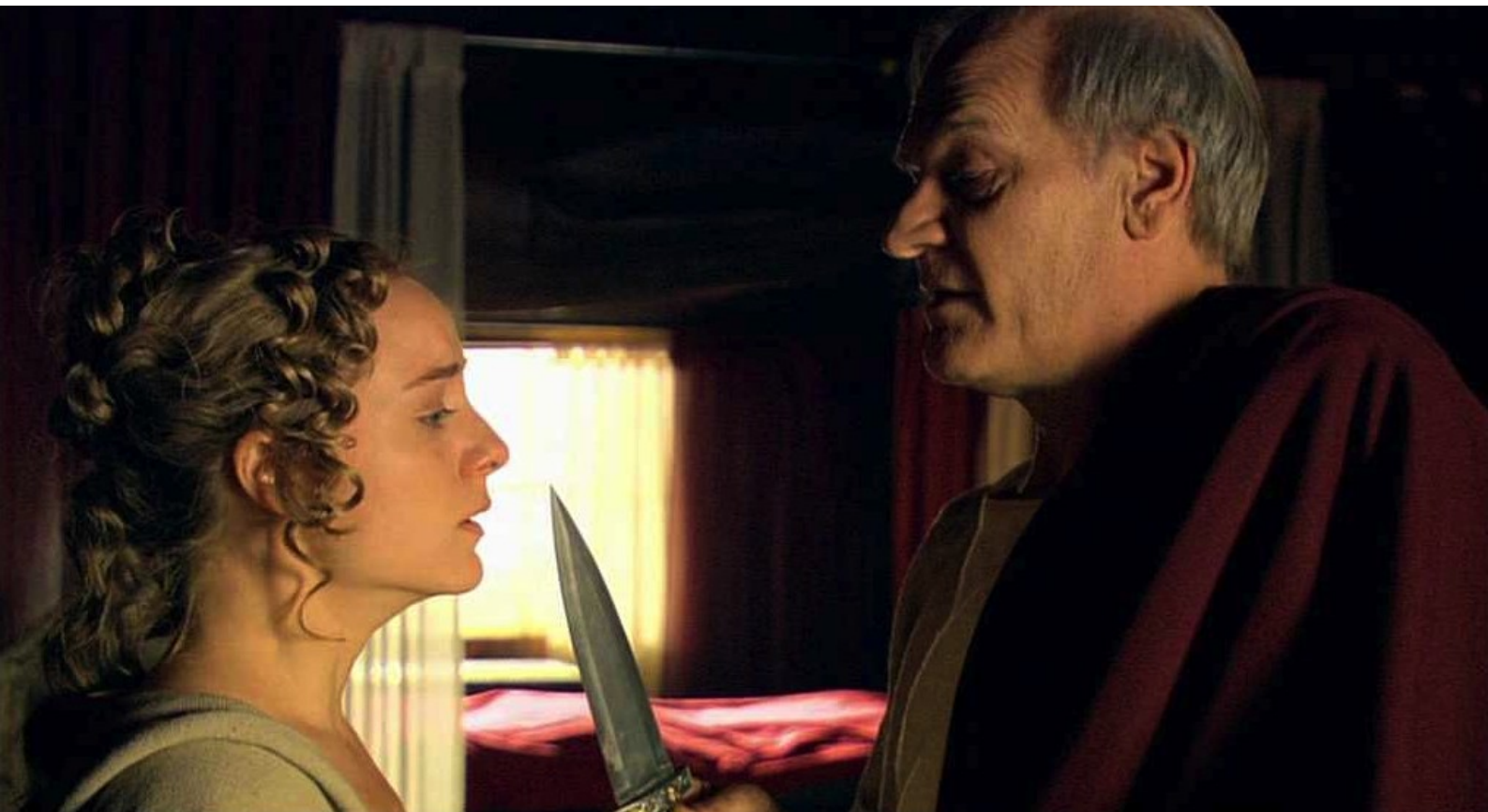
Hispania, la Leyenda : elle est amenée à Galba,