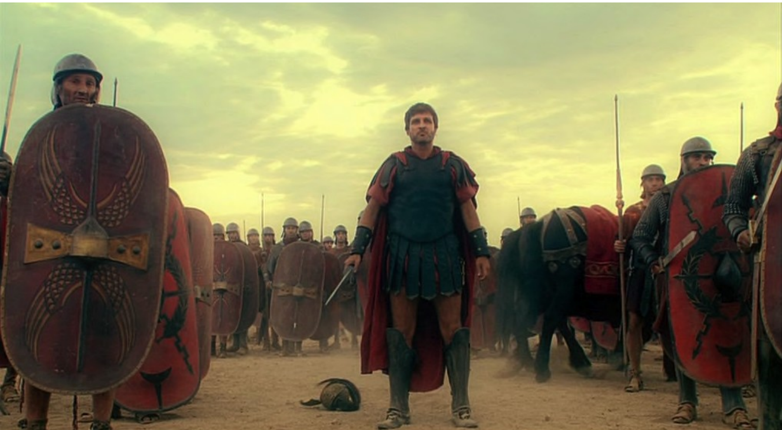
Hispania, la Leyenda : et Marco fait avancer les siennes.