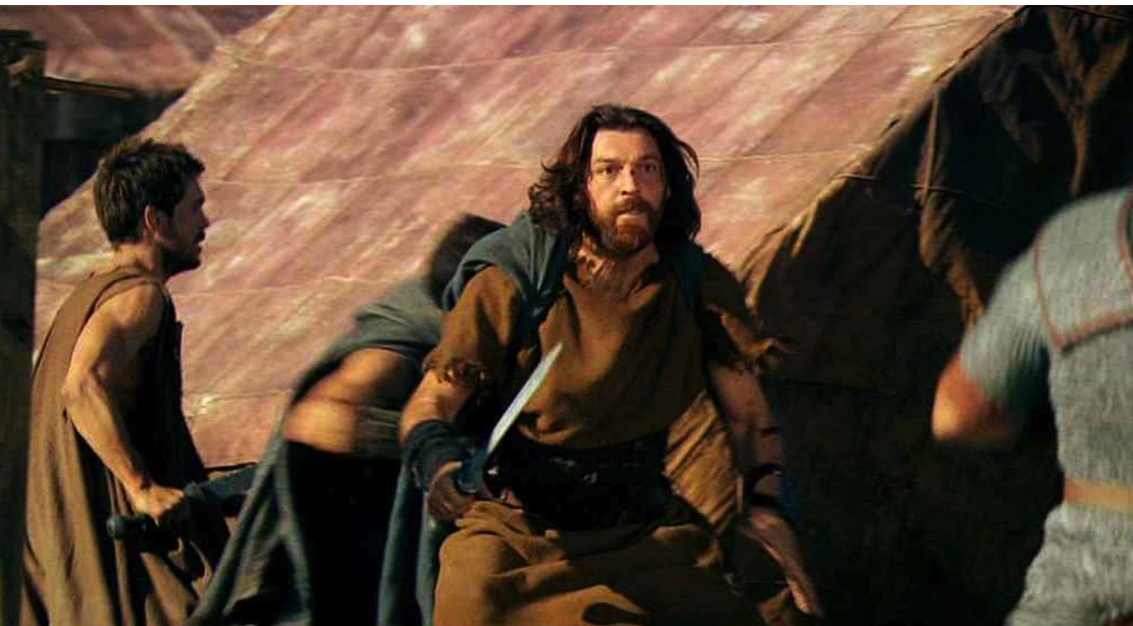
Hispania, la Leyenda : puis ils libèrent les prisonniers,