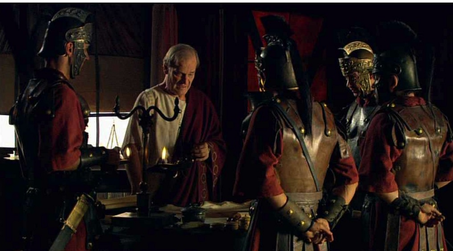
Hispania, la Leyenda : Alors le préteur prépare la grande bataille avec les officiers,