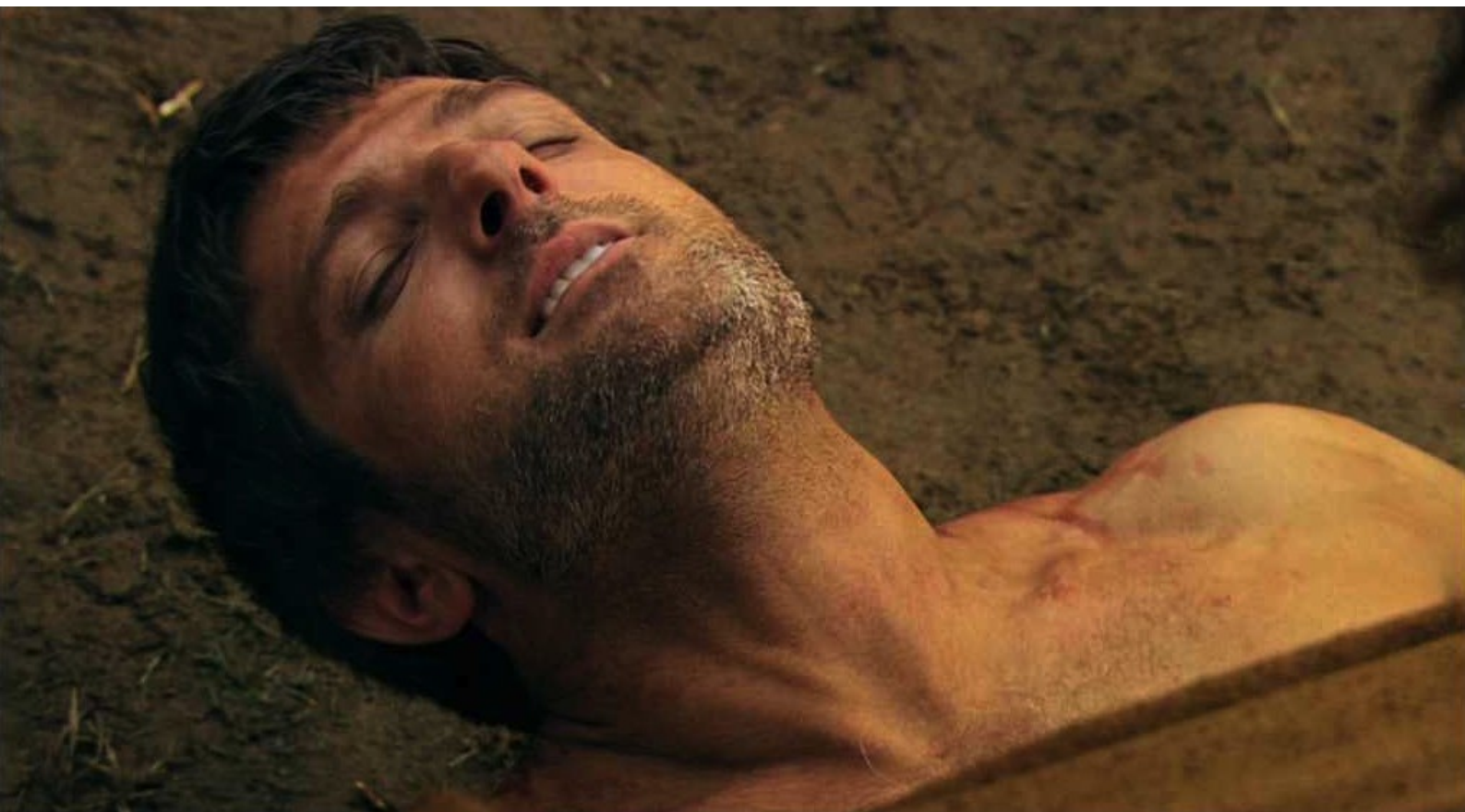
Hispania, la Leyenda : le général, vaincu,