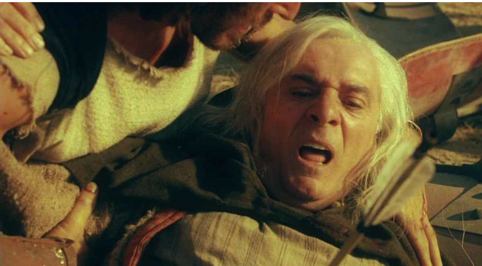
Hispania, la Leyenda : qui meurt dans les bras de ses proches.