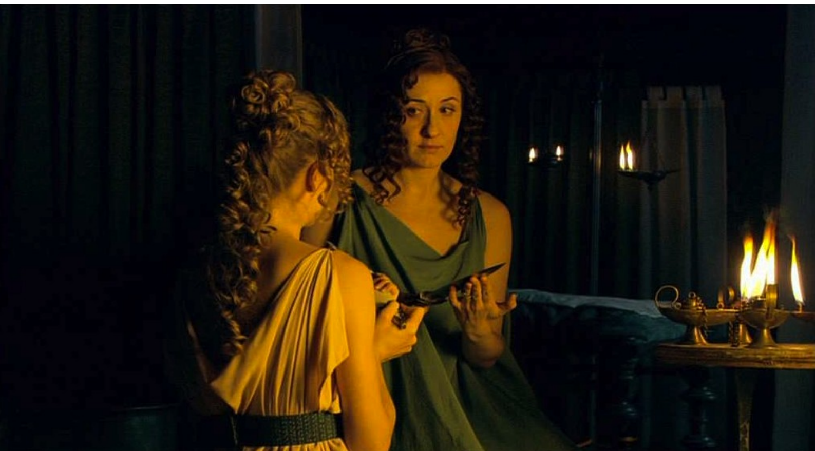
Hispania, la Leyenda : dans le but d'assassiner Galba ;