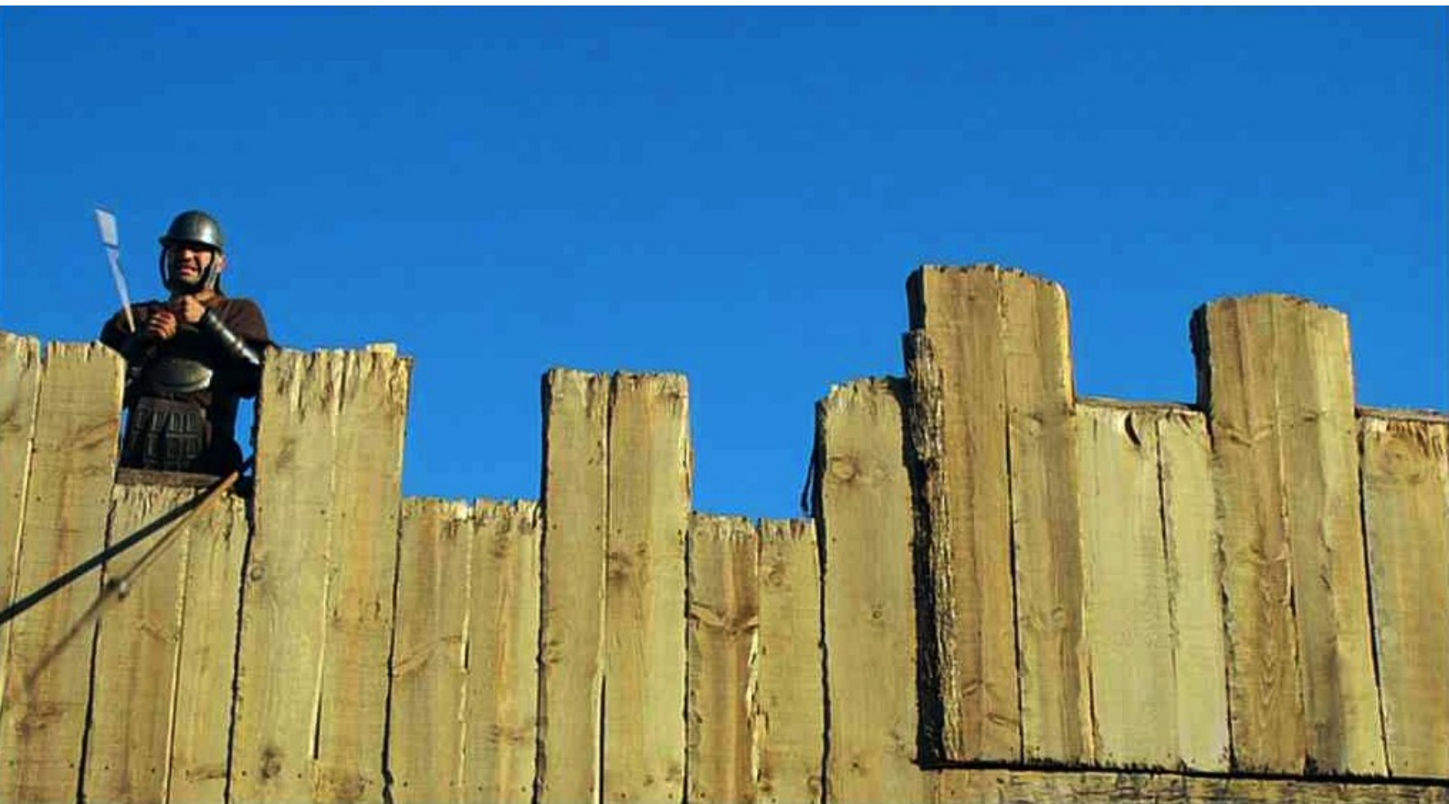
Hispania, la Leyenda : et tuent les gardes à coups de flèches ;