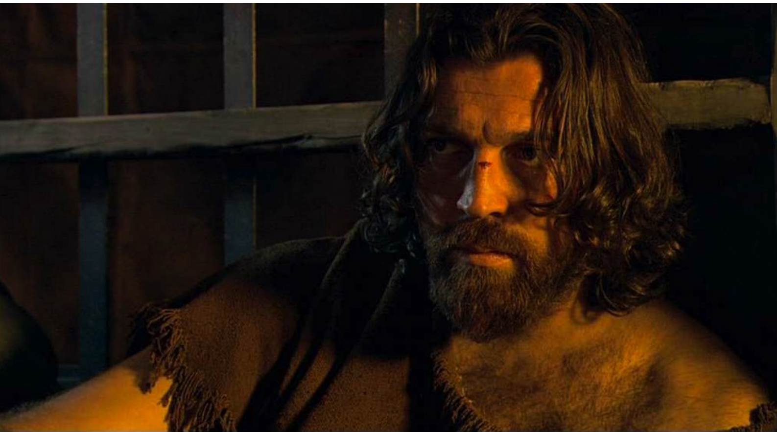
Hispania, la Leyenda : puis fait tirer Sandro de sa geôle...