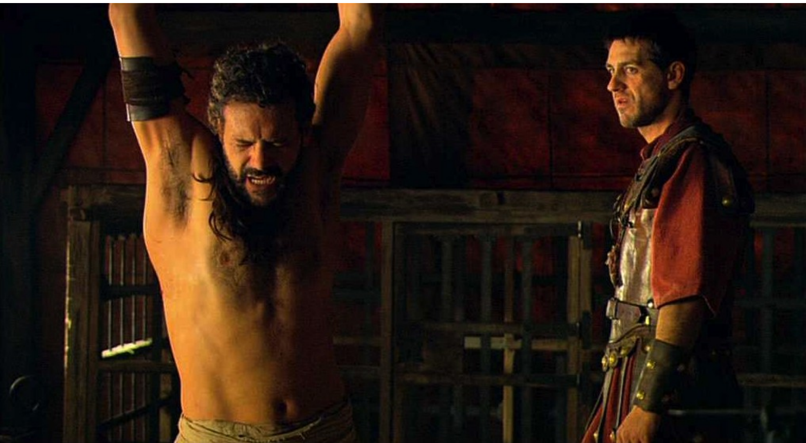
Hispania, la Leyenda : et le fait fouetter,