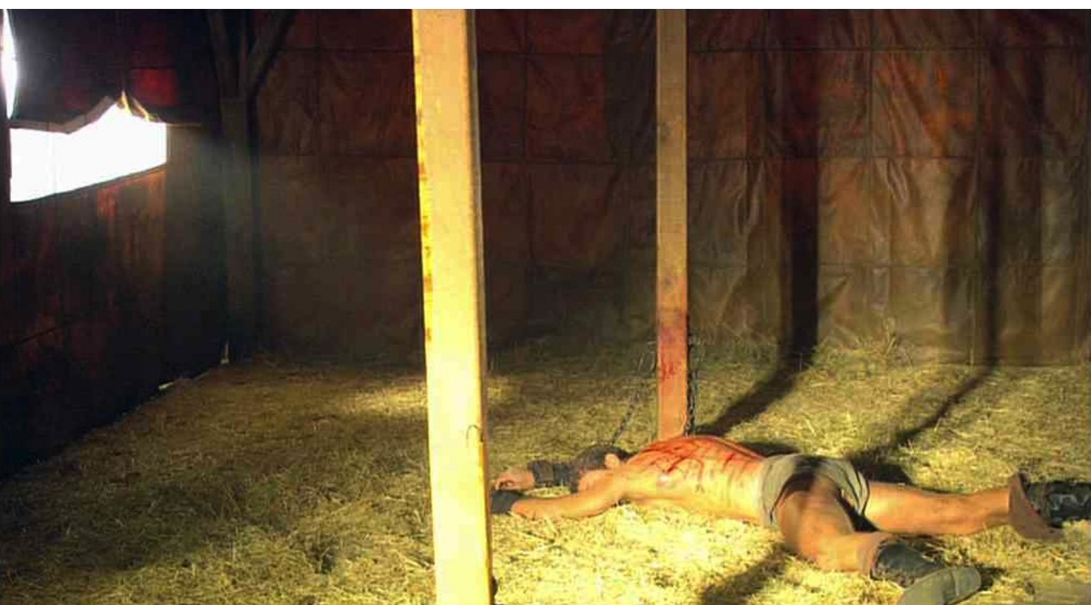
Hispania, la Leyenda : et enchaîner Marco, complice de Claudia.