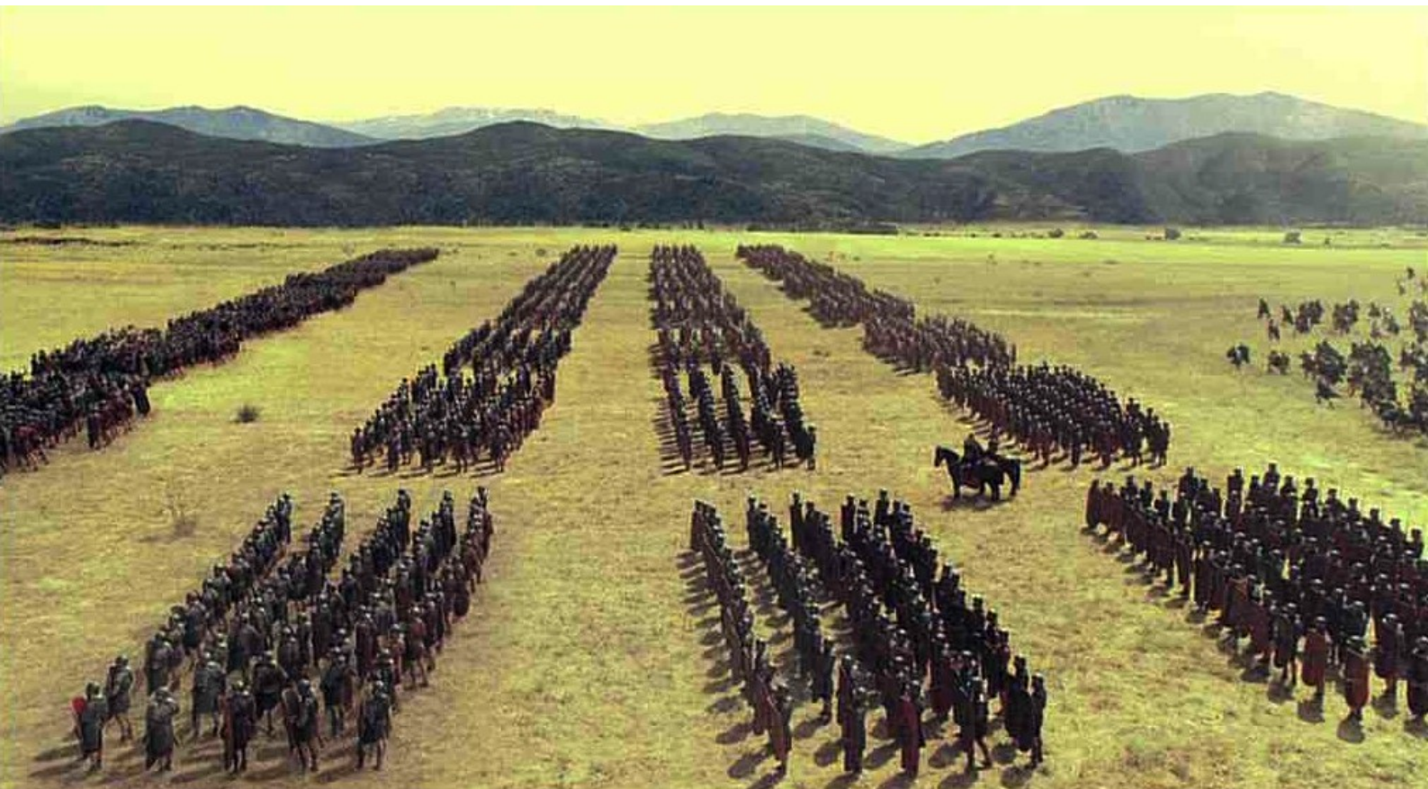
Hispania, la Leyenda : et derrière les lignes romaines,