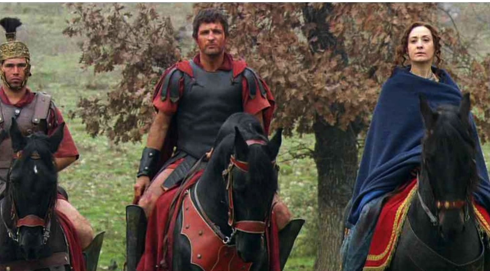
Hispania, la Leyenda : et ils font retraite ensemble.