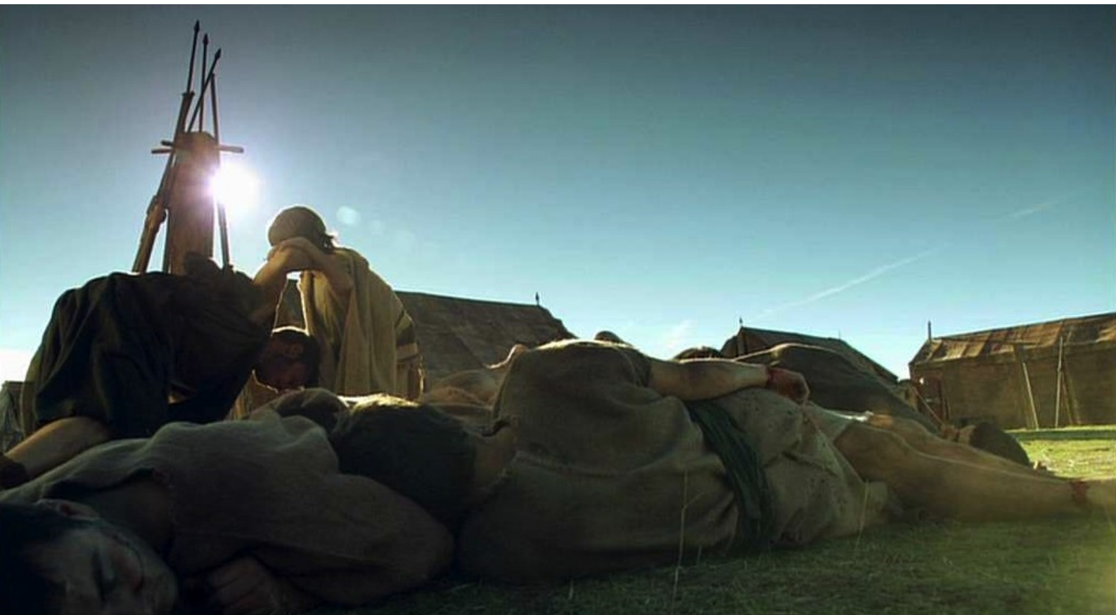
Hispania, la Leyenda : Il l'aide à se relever...