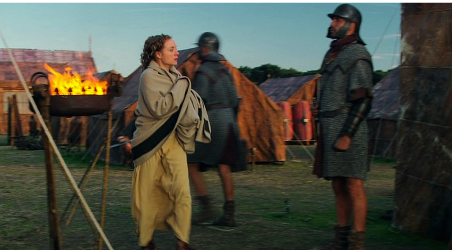
Hispania, la Leyenda : Pour aider sa maîtresse, Helena veut lui apporter le poignard,