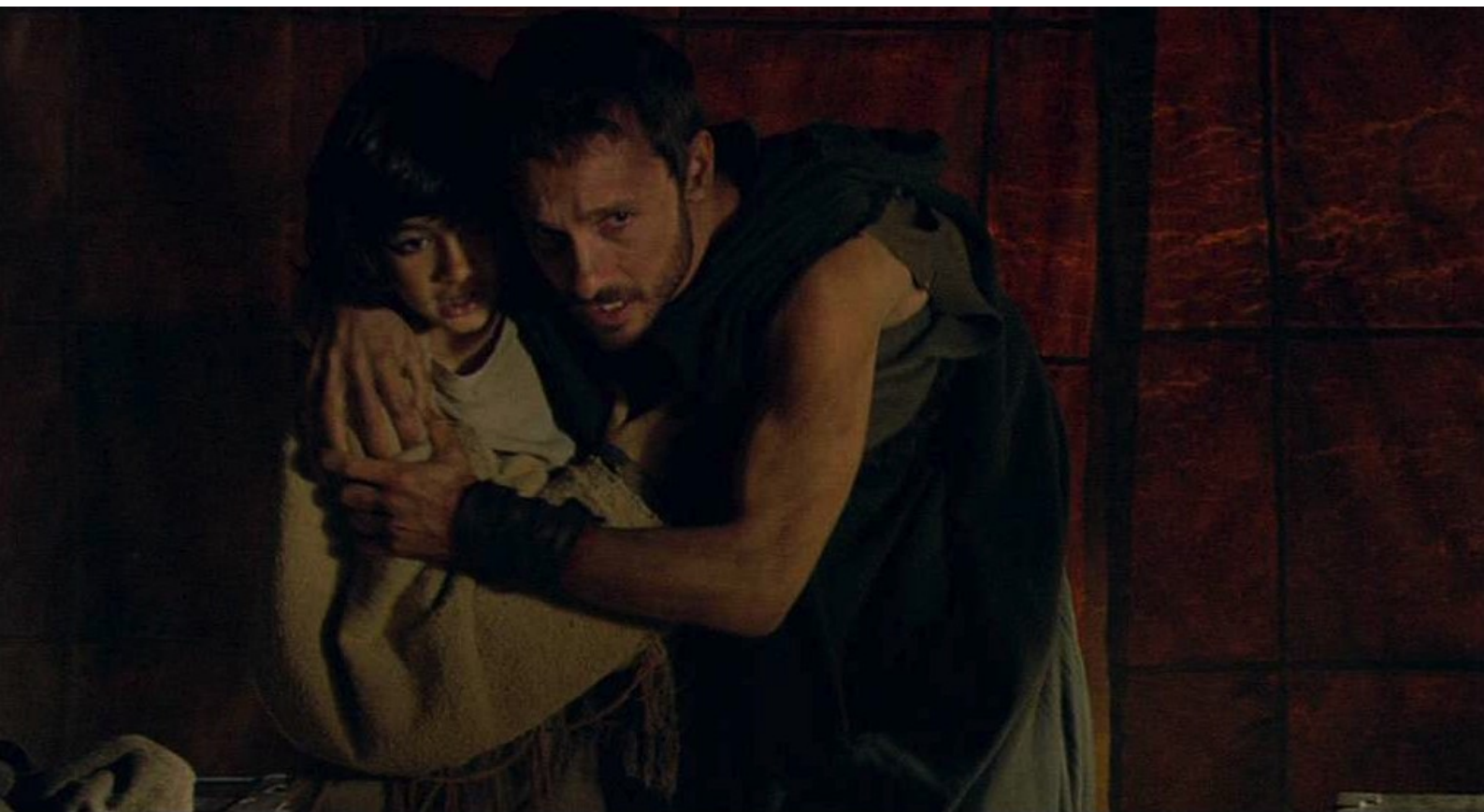
Hispania, la Leyenda : et l'introduit dans une tente,