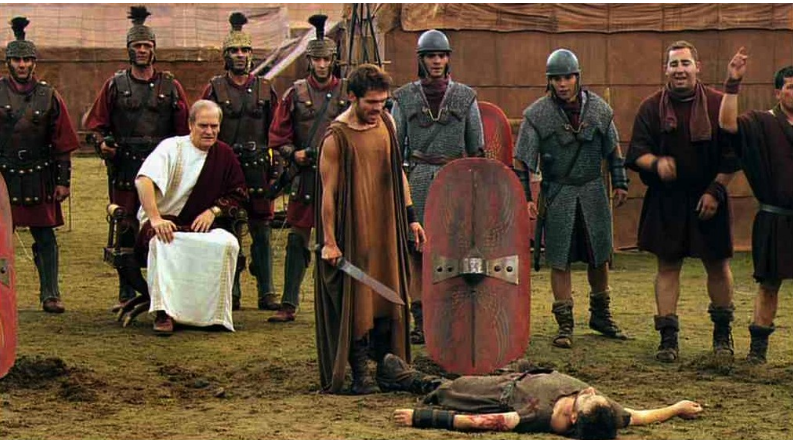
Hispania, la Leyenda : Galba organise des combats à mort entre les rebelles prisonniers,