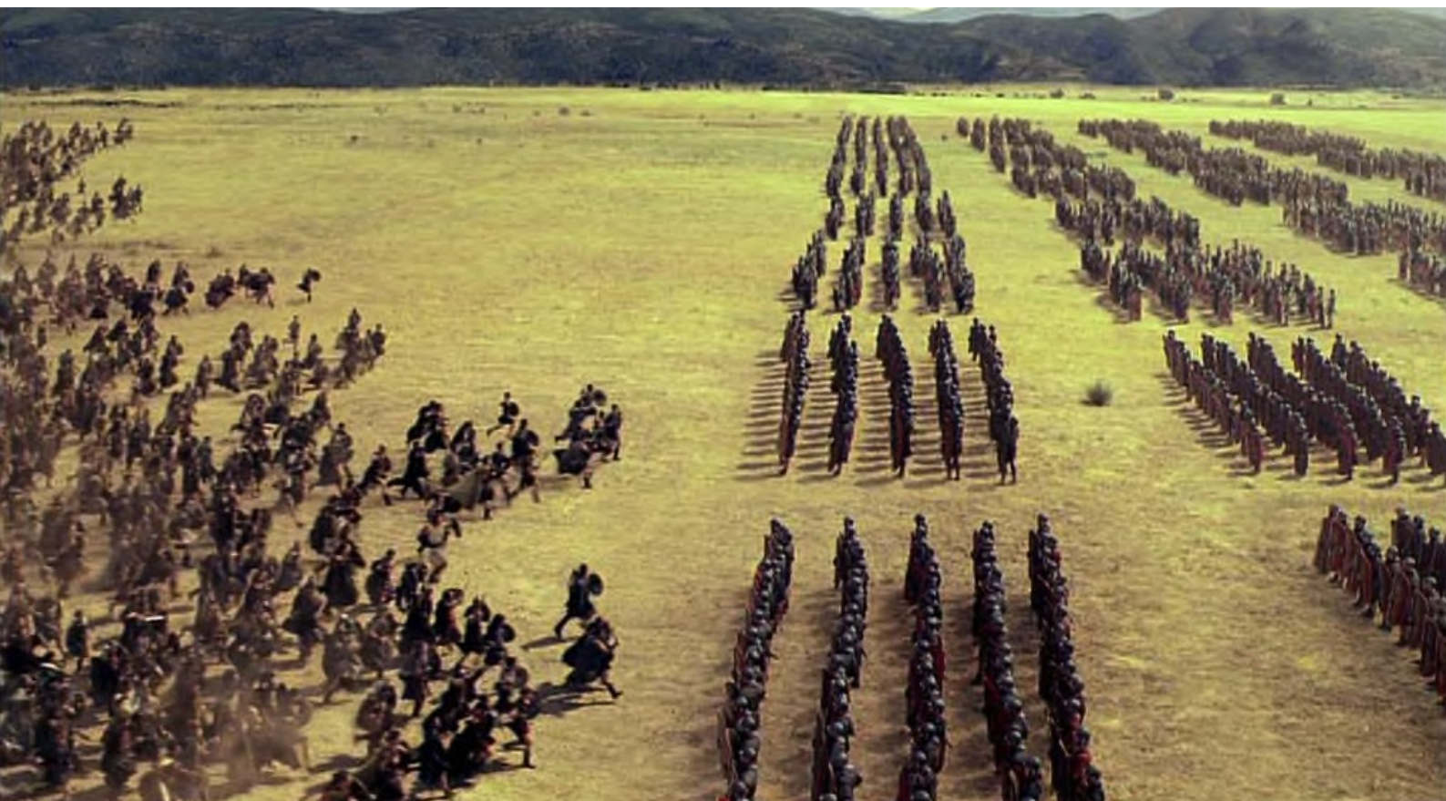
Hispania, la Leyenda : et se lancent à l'attaque devant...