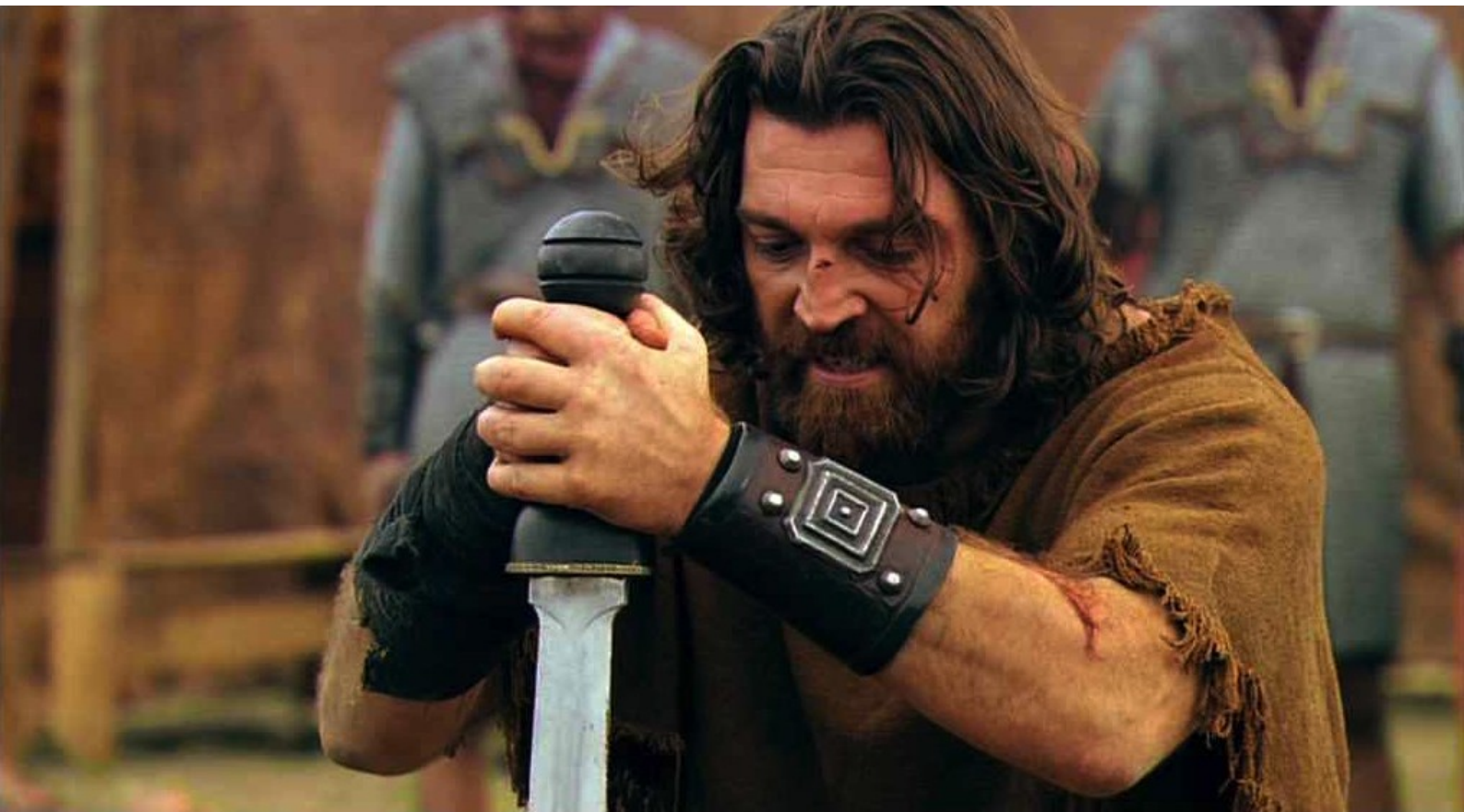
Hispania, la Leyenda : va être achevé,