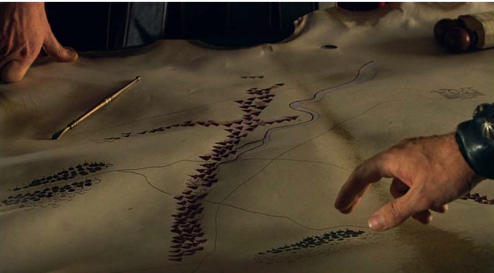
Hispania, la Leyenda : définissant la tactique ;