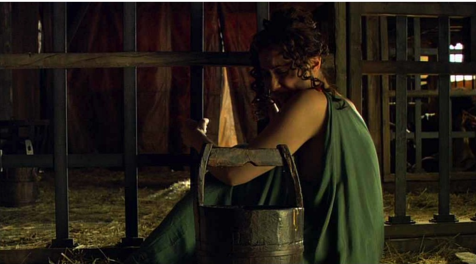
Hispania, la Leyenda : avec lesquels elle doit partager même le seau d'aisance.