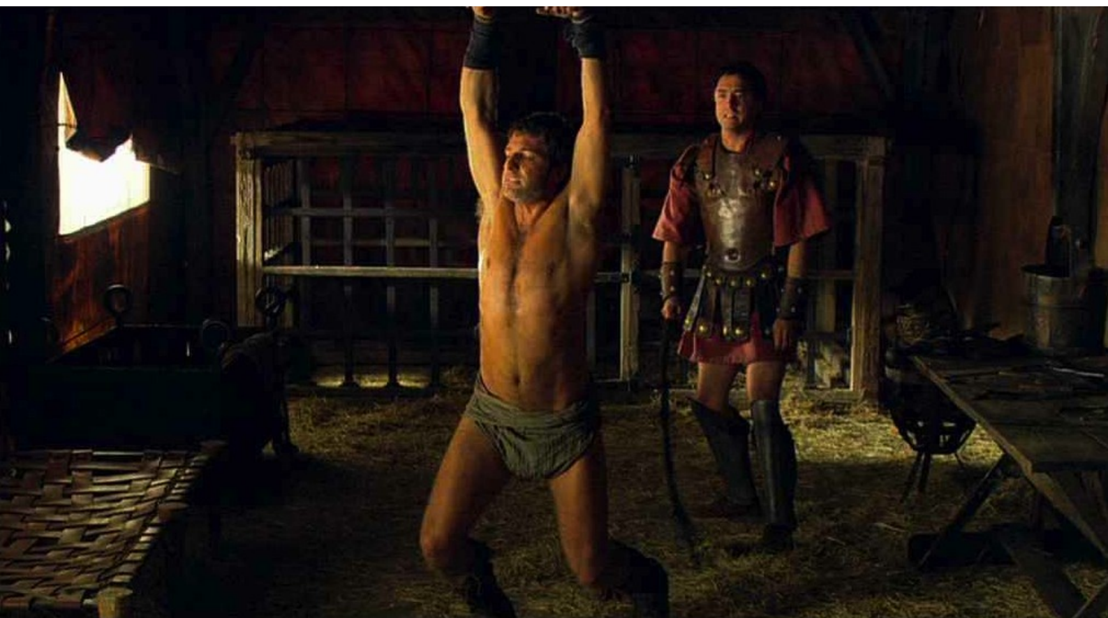
Hispania, la Leyenda : Il fait aussi flageller douloureusement...