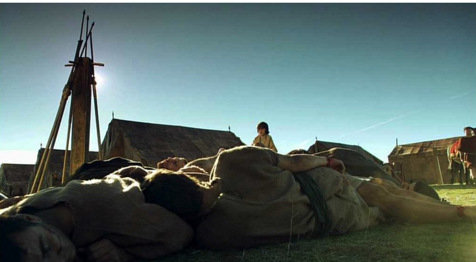
Hispania, la Leyenda : Alors arrive Tirso,