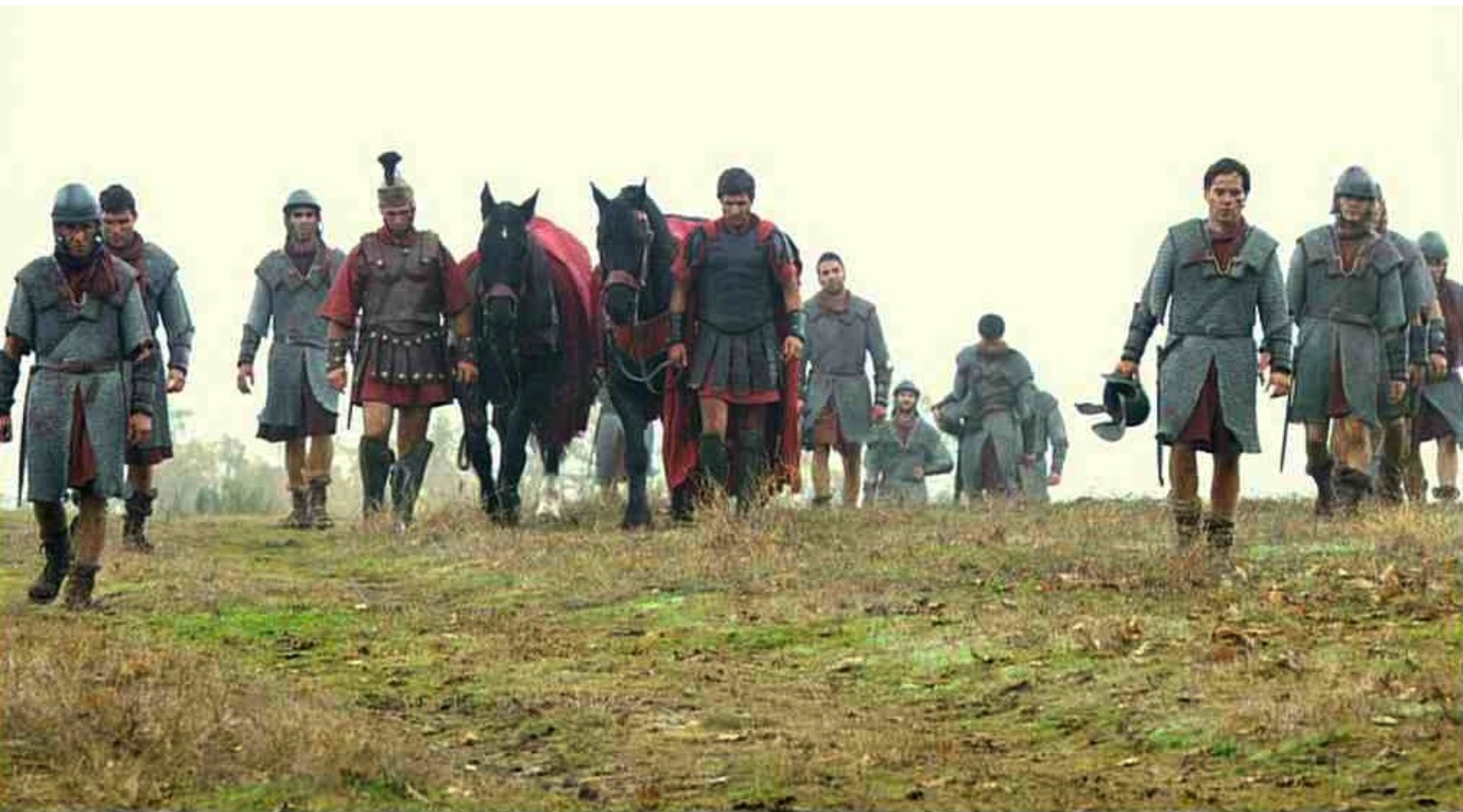
Hispania, la Leyenda : tandis que les légionnaires en déroute se retirent.