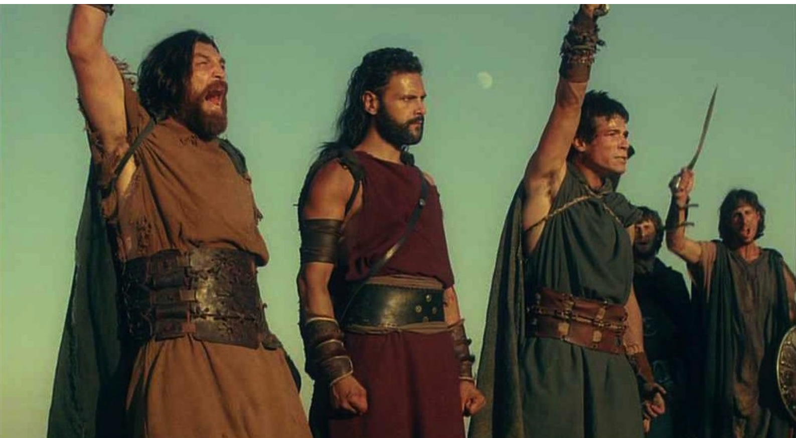
Hispania, la Leyenda : et les Ibères poussent des cris de victoire,