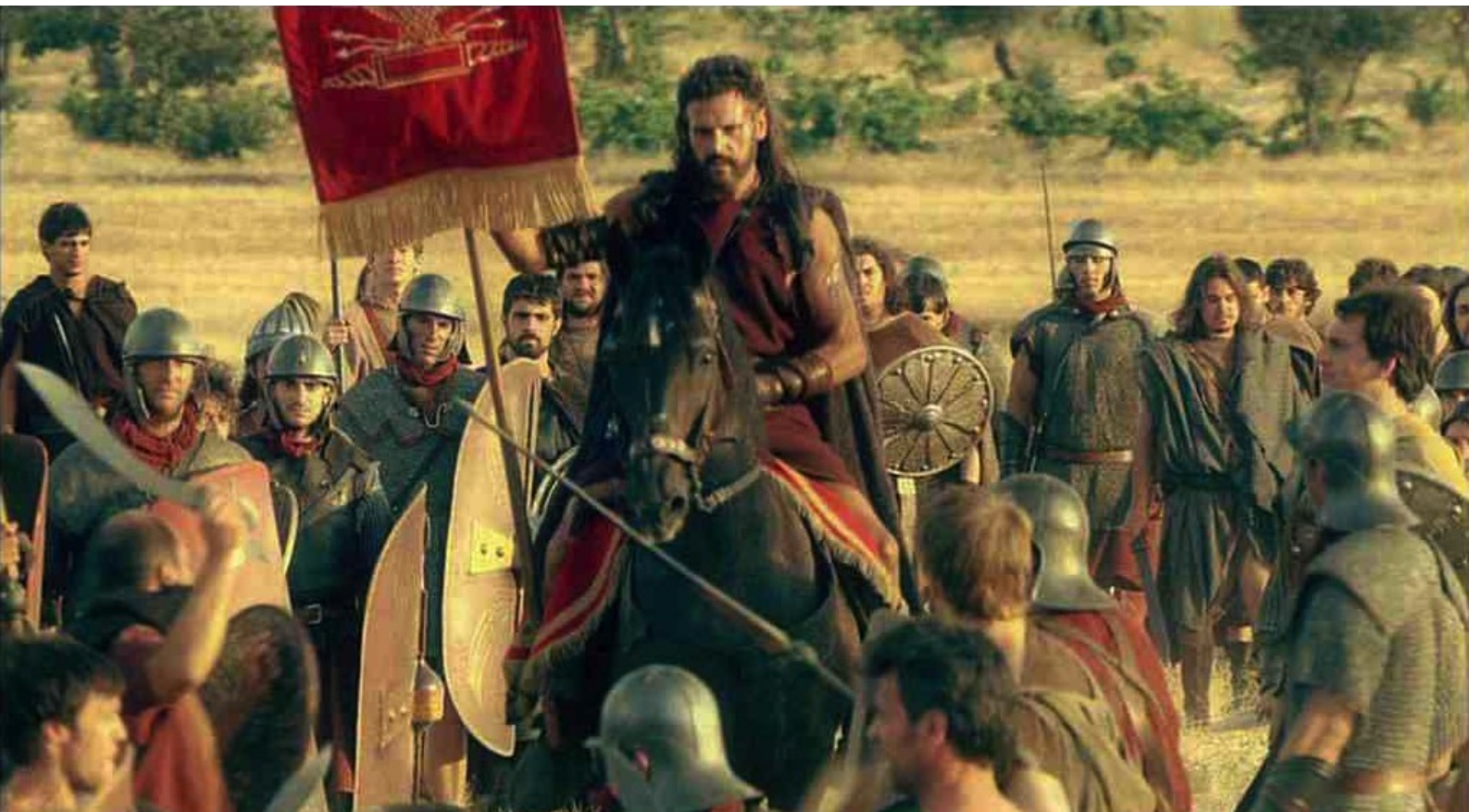
Hispania, la Leyenda : C'est alors que Viriate arrive avec l'étendard pris aux Romains,