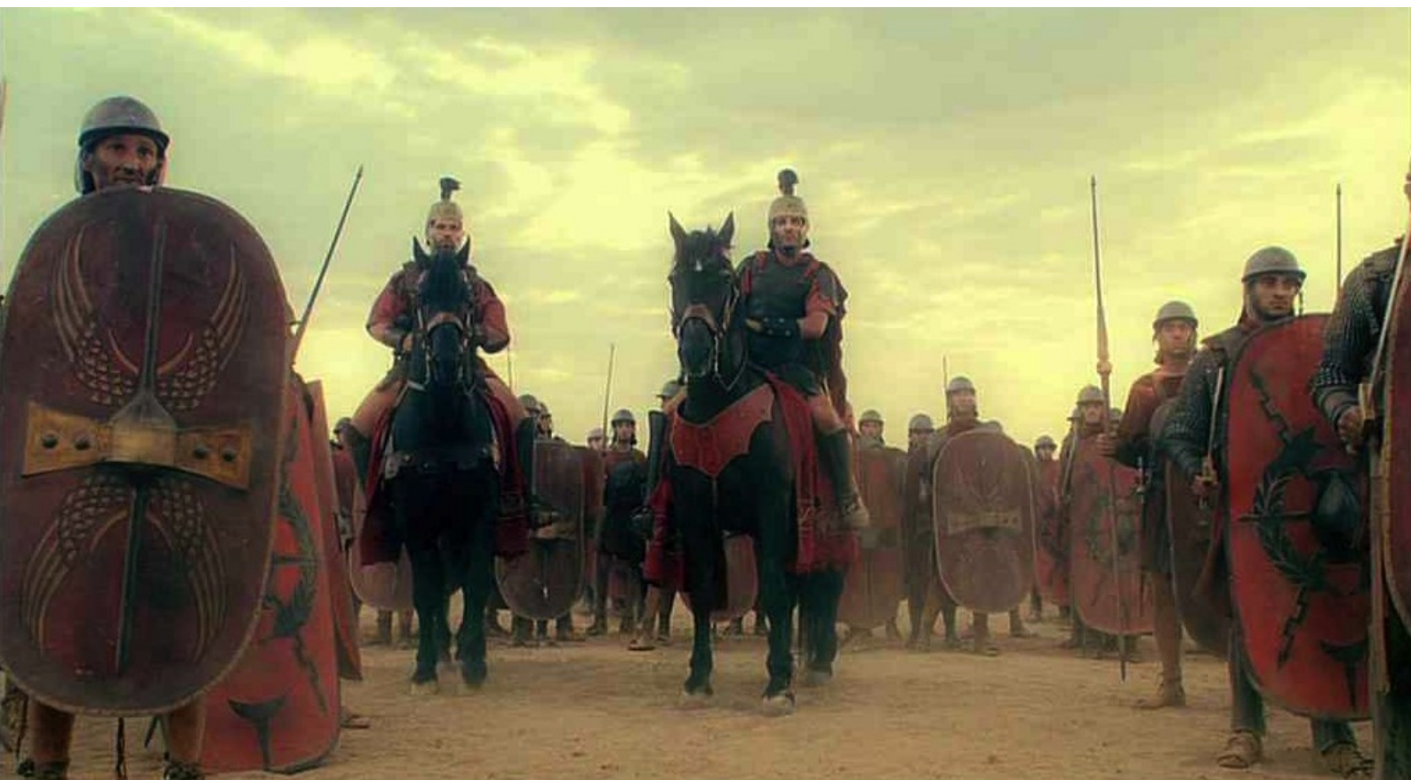
Hispania, la Leyenda : Ailleurs, la grande bataille va commencer :