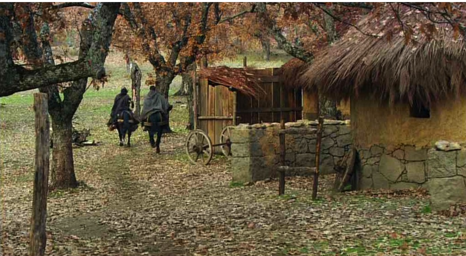
Hispania, la Leyenda : Viriate et Paulo vont à Rome pour essayer de trouver Altea et Nerea ;