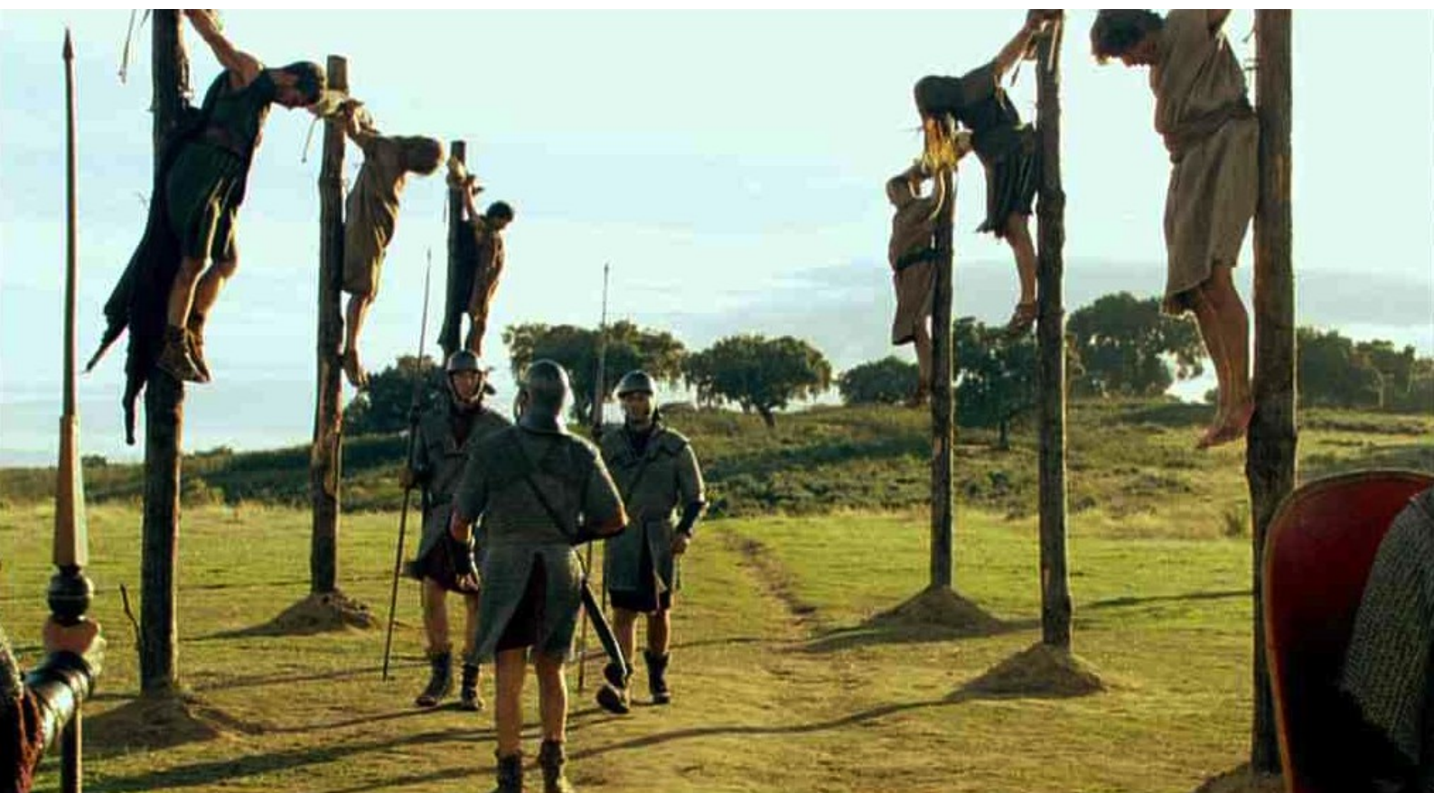
Hispania, la Leyenda : Pour que les cadavres des crucifiés ne pourrissent pas devant le camp,