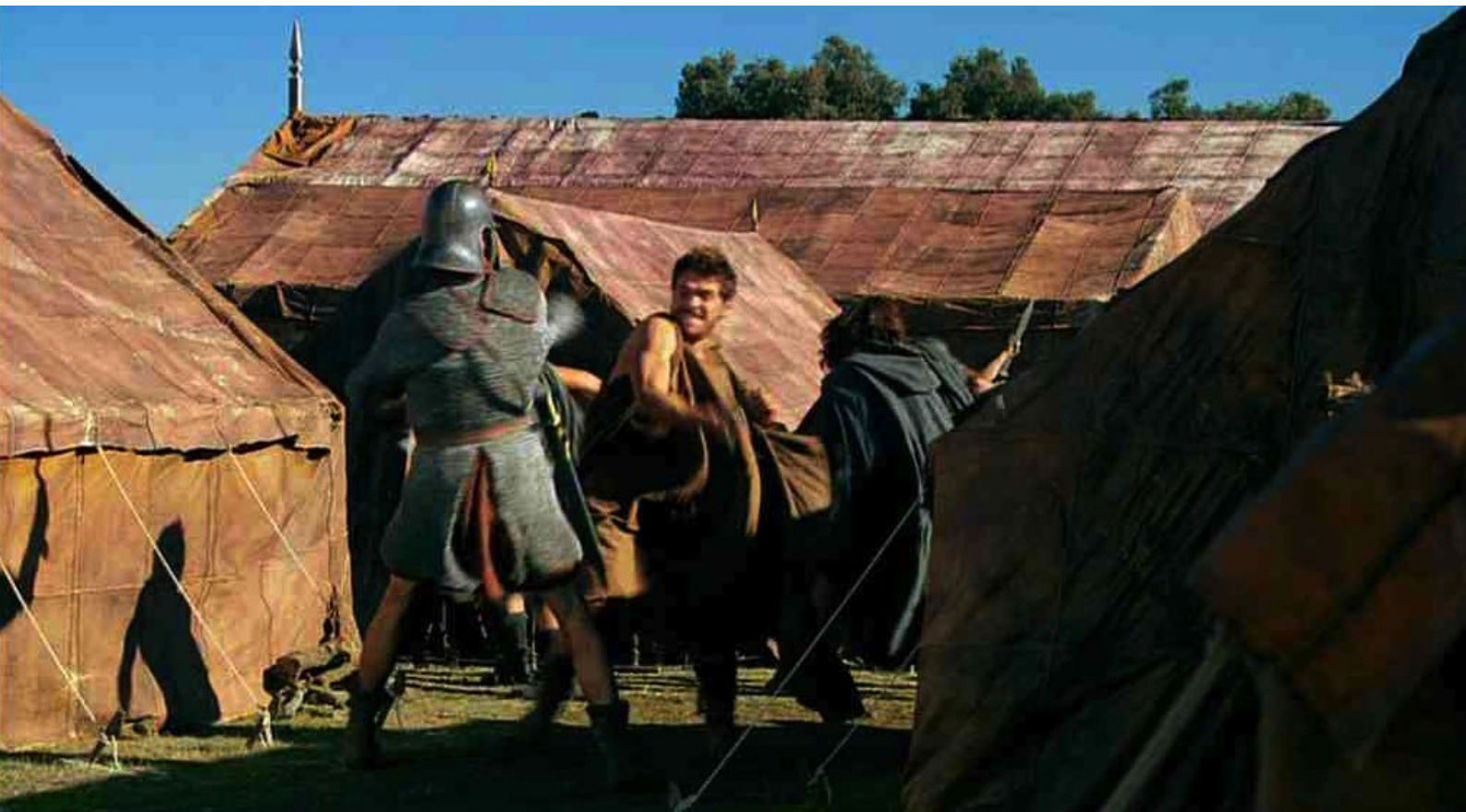
Hispania, la Leyenda : qui massacrent entre les tentes les rares soldats romains.