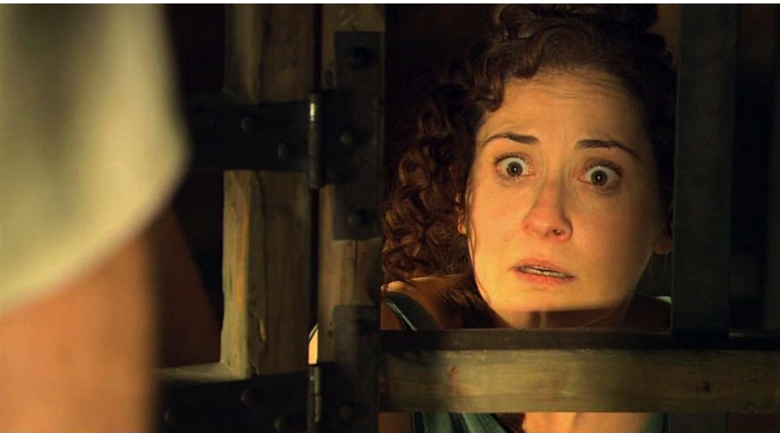
Hispania, la Leyenda : sa femme en cage avec les rebelles prisonniers,