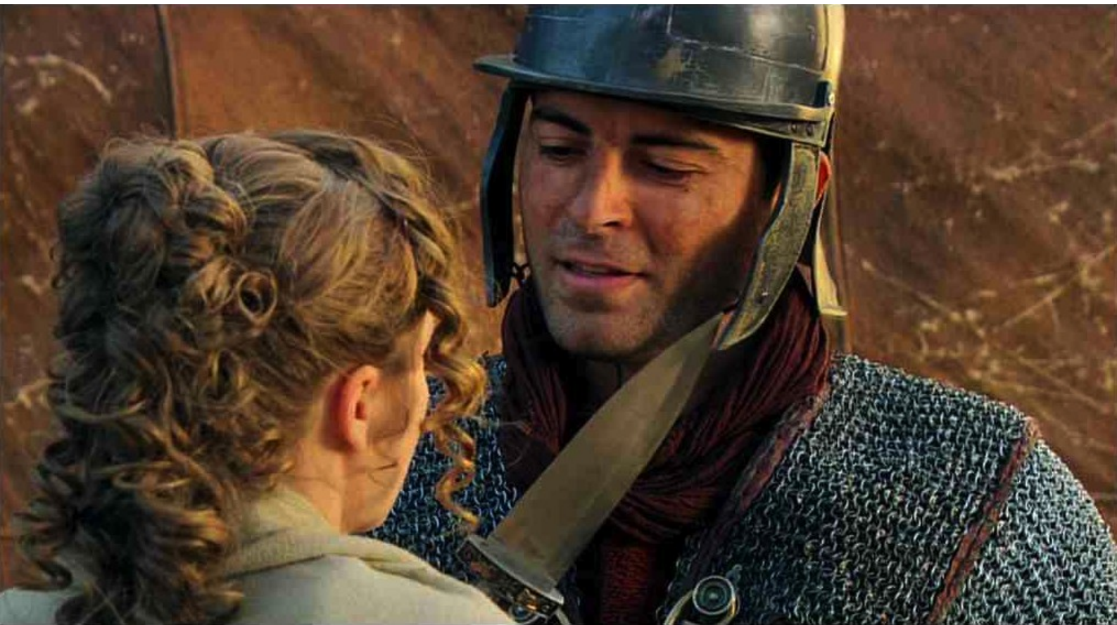
Hispania, la Leyenda : mais, démasquée par la sentinelle,