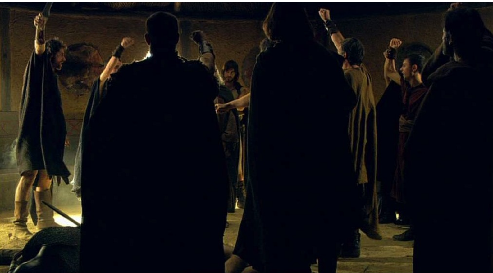
Hispania, la Leyenda : Confiant dans cette armée, le Conseil des Notables...