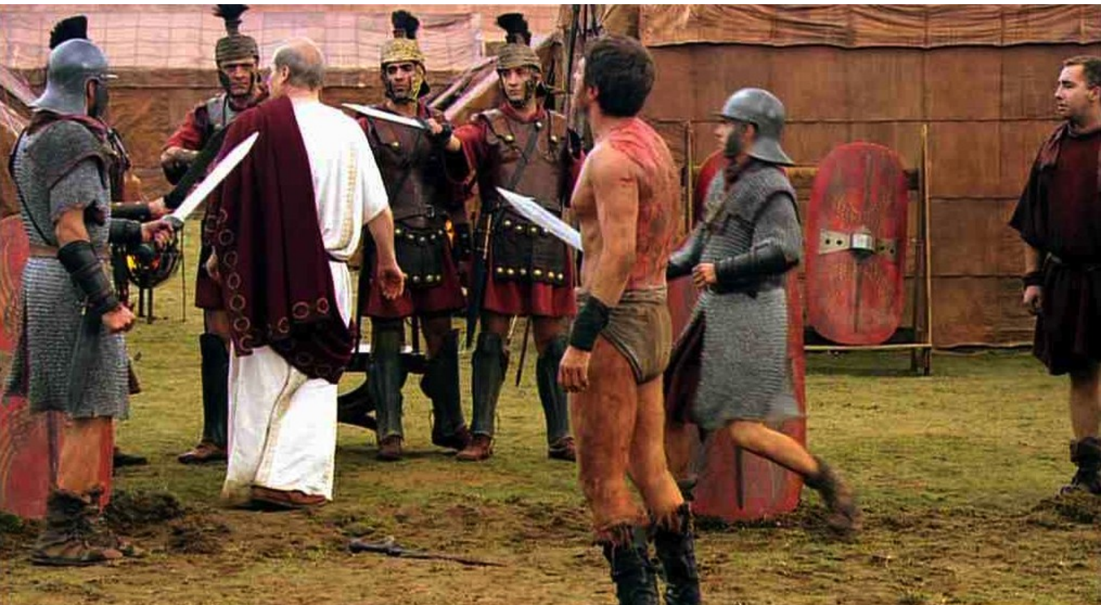
Hispania, la Leyenda : et ils se retournent brusquement contre Galba,