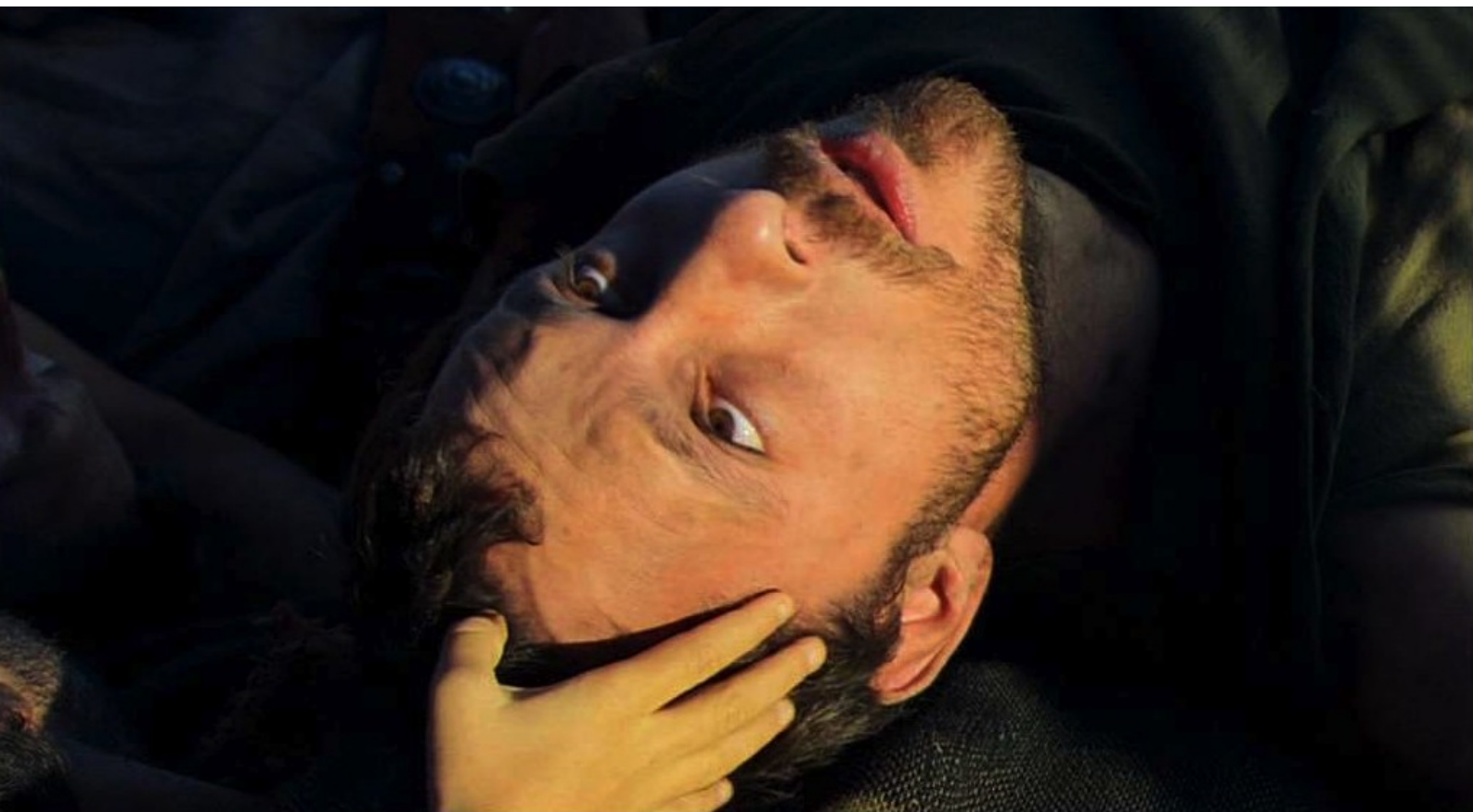
Hispania, la Leyenda : et voit son oncle, pas mort, ouvrir les yeux ;