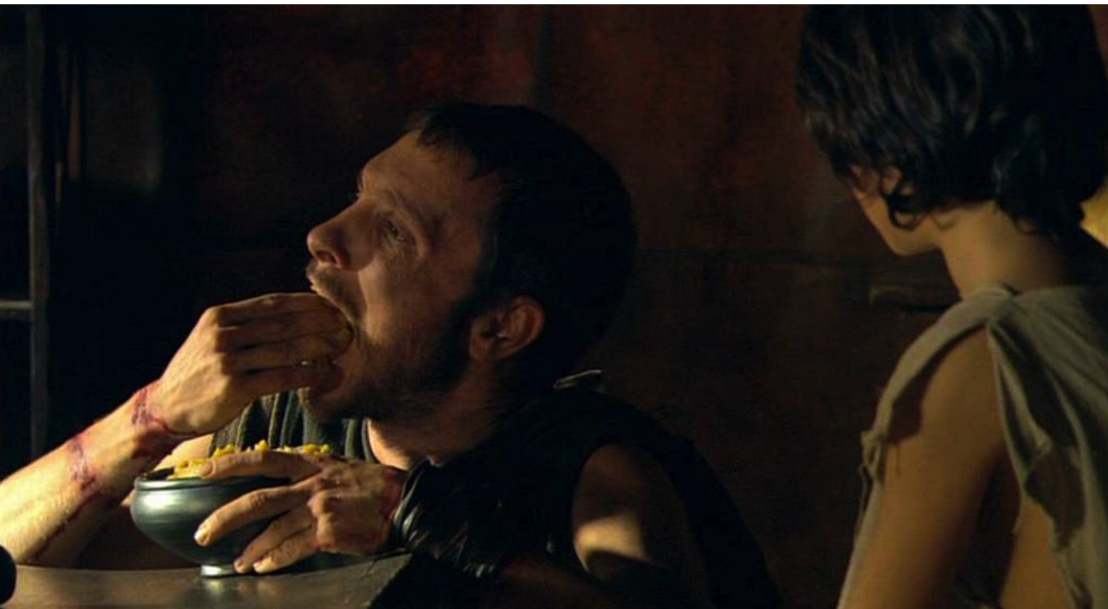
Hispania, la Leyenda : pour qu'il puisse se restaurer ;