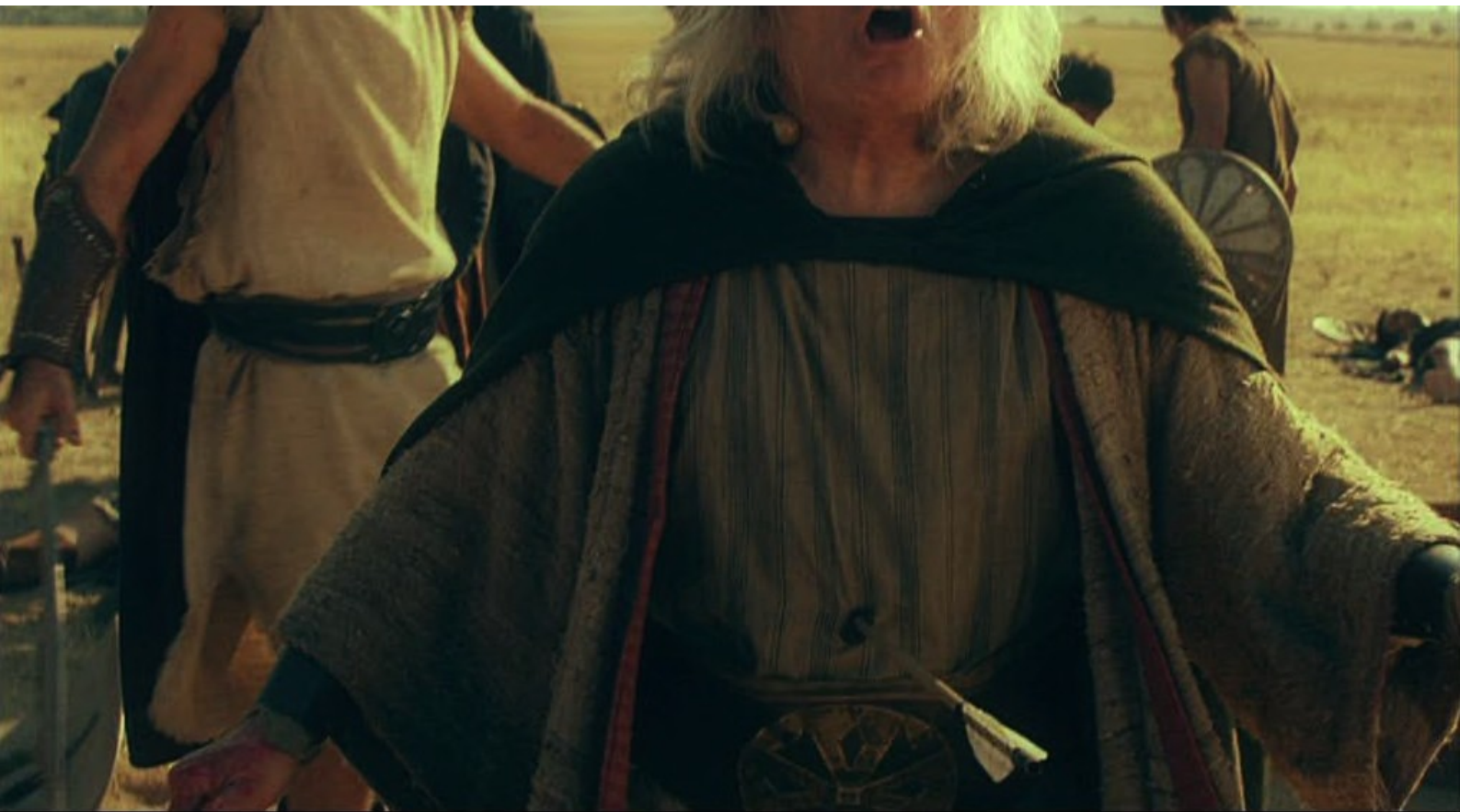
Hispania, la Leyenda : contre le chef espagnol, César,