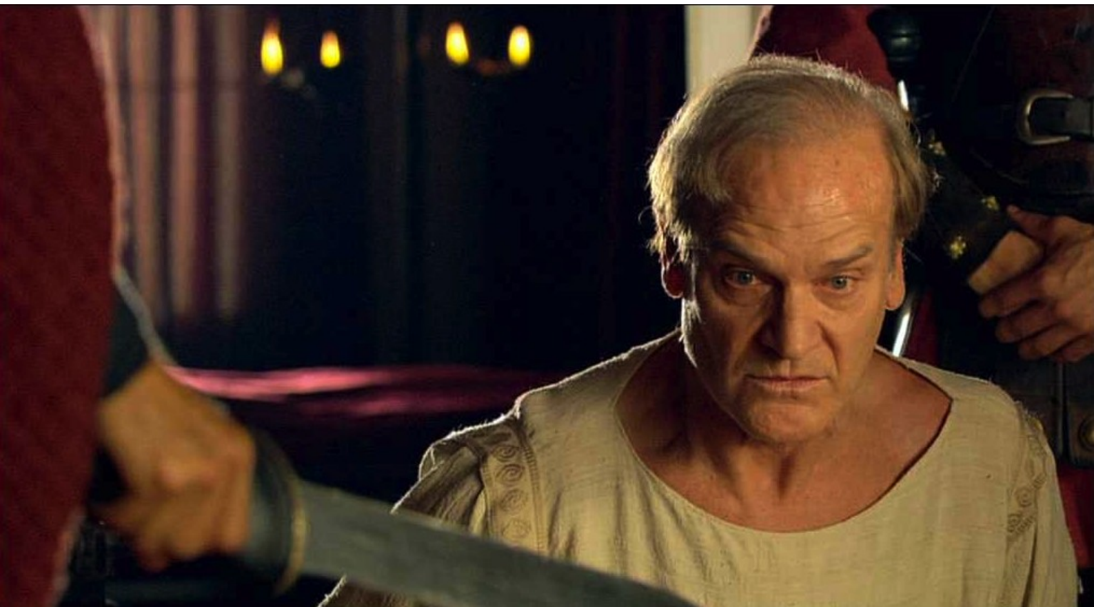
Hispania, la Leyenda : Marco pourrait se venger et le tuer sous sa tente,