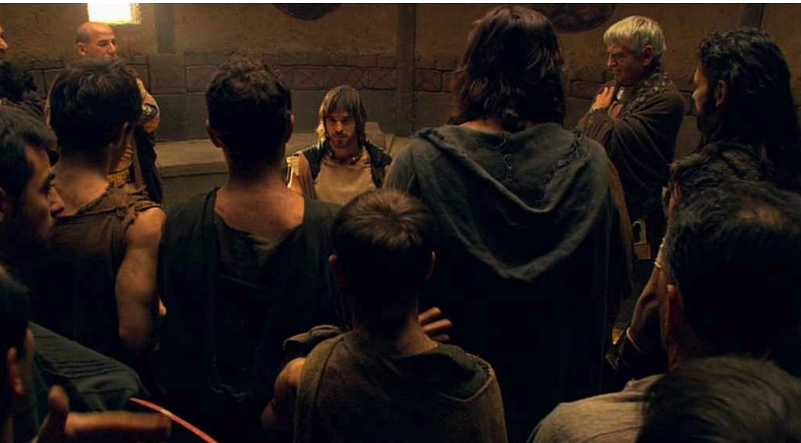
Hispania, la Leyenda : Puis Dario est élu chef en remplacement de son père ;