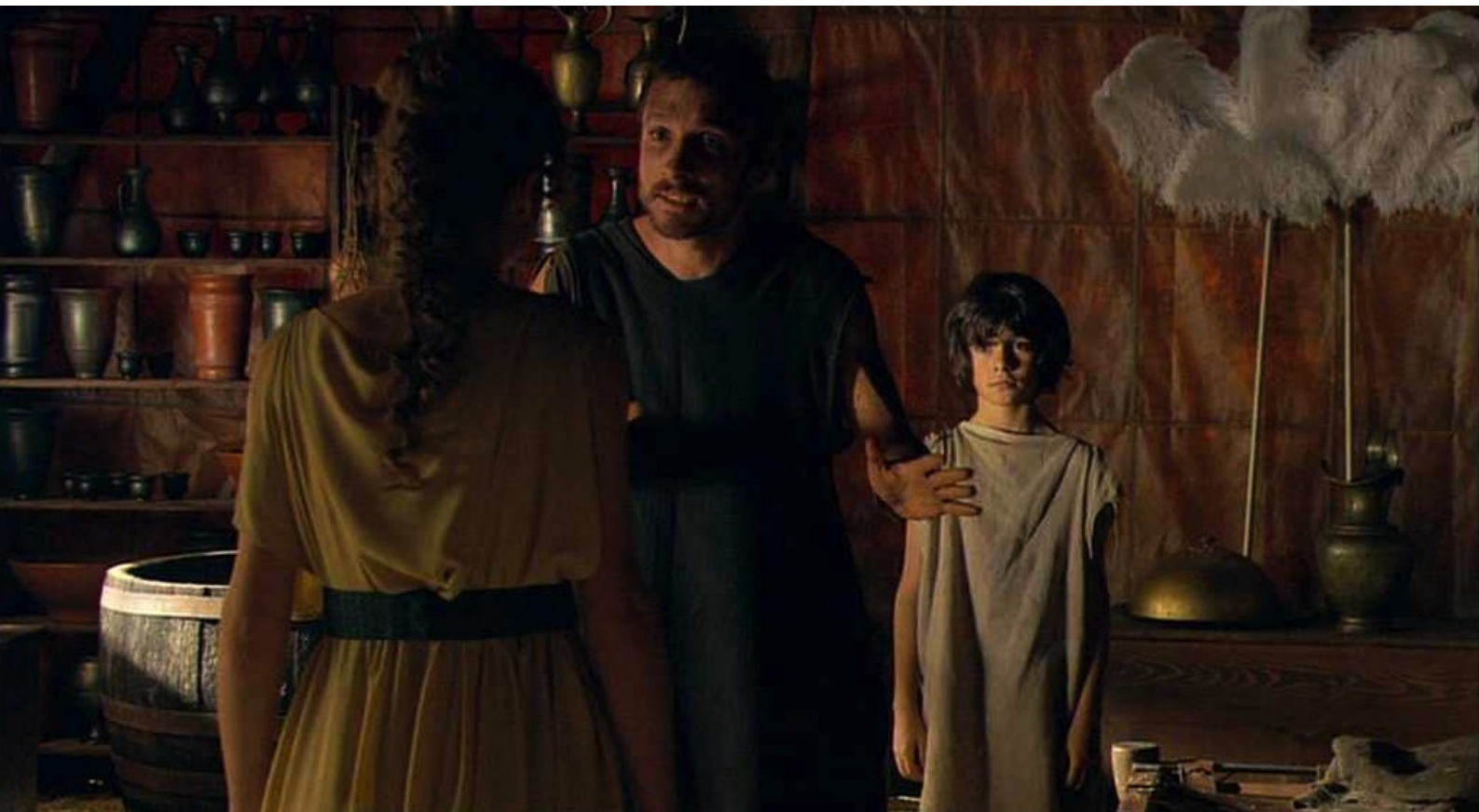
Hispania, la Leyenda : et Hector peine à la calmer.