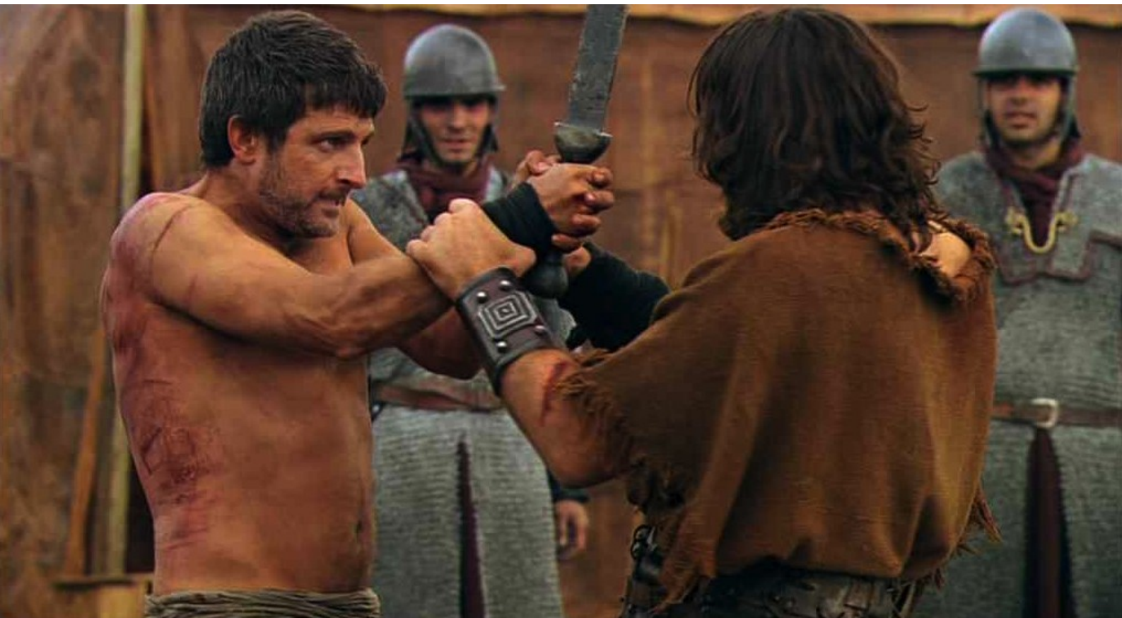
Hispania, la Leyenda : dans un duel sans pitié ;