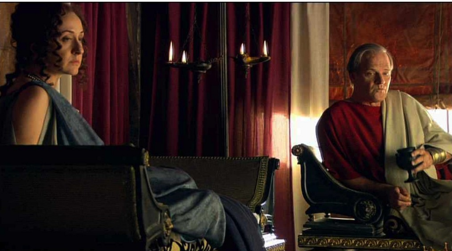
Hispania, la Leyenda : et restaurer Claudia et son mari dans leurs dignités.