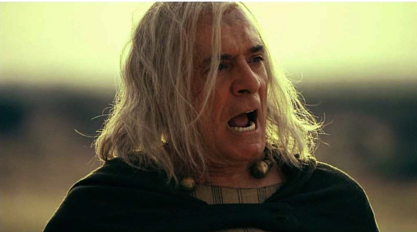
Hispania, la Leyenda : César harangue ses troupes,