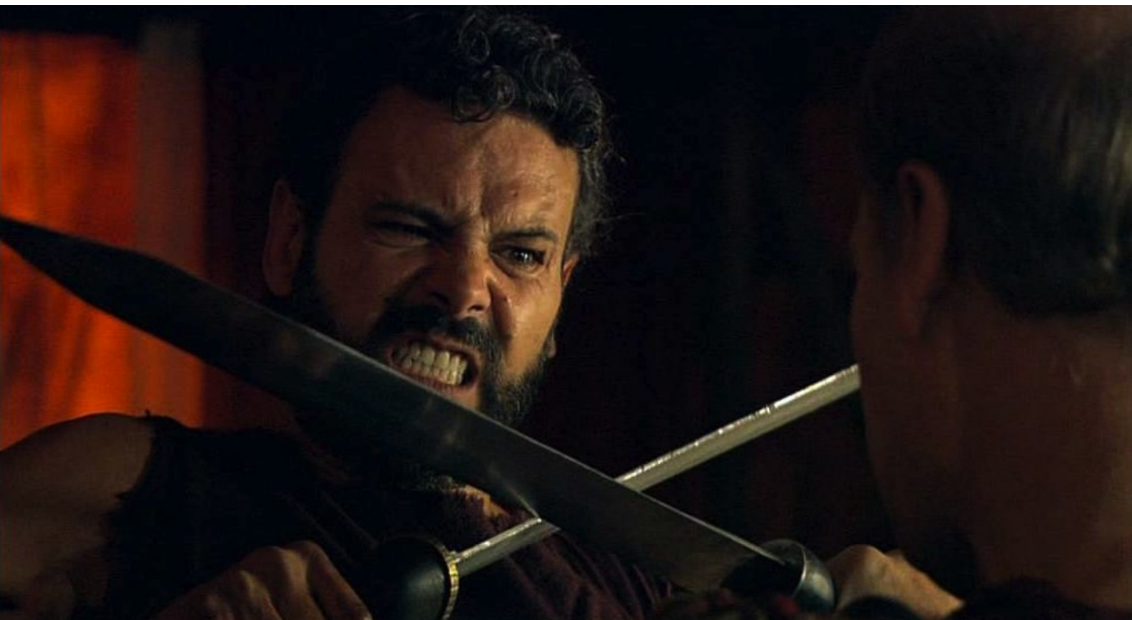
Hispania, la Leyenda : Viriate, libéré lui aussi, trouve le préteur et l'affronte...